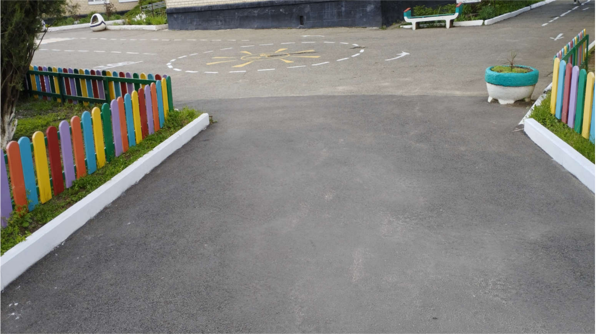
Φοτο Νο 1