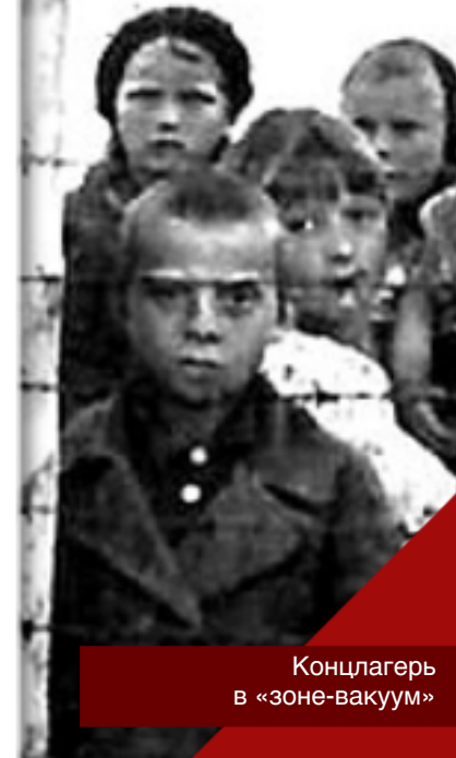
Концлагерь в «зоне-вакуум»