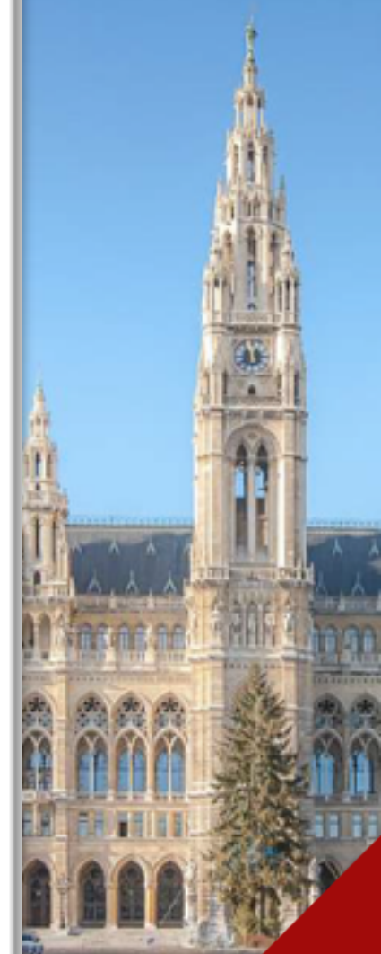
Вена Венская ратуша