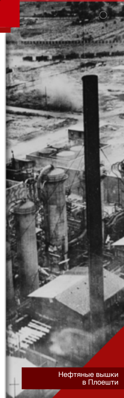
Нефтяные вышки в Плоешти