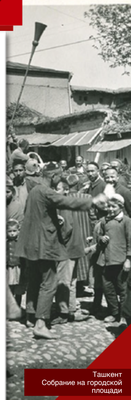
Ташкент Собрание на городской площади

Боевыми орденами и медалями были награждены 78 000 воинов, а 112 туркмен получили звание Героя Советского Союза.