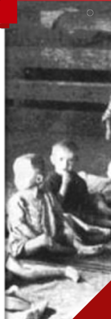
Детский барак концлагеря Саласпилс

● 14 сентября — 24 ноября 1944 г. — Прибалтийская операция по освобождению от немецких войск Эстонии, Латвии и Литвы.