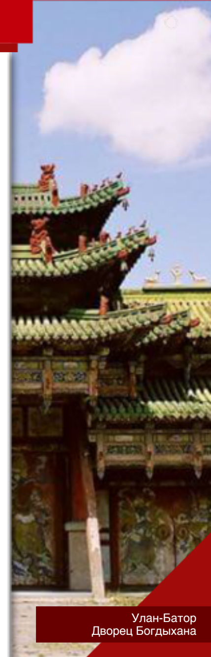
Улан-Батор Дворец Богдыхана

20 октября 1945 г. — 99,99% монголов высказались в поддержку независимости страны от Китая.