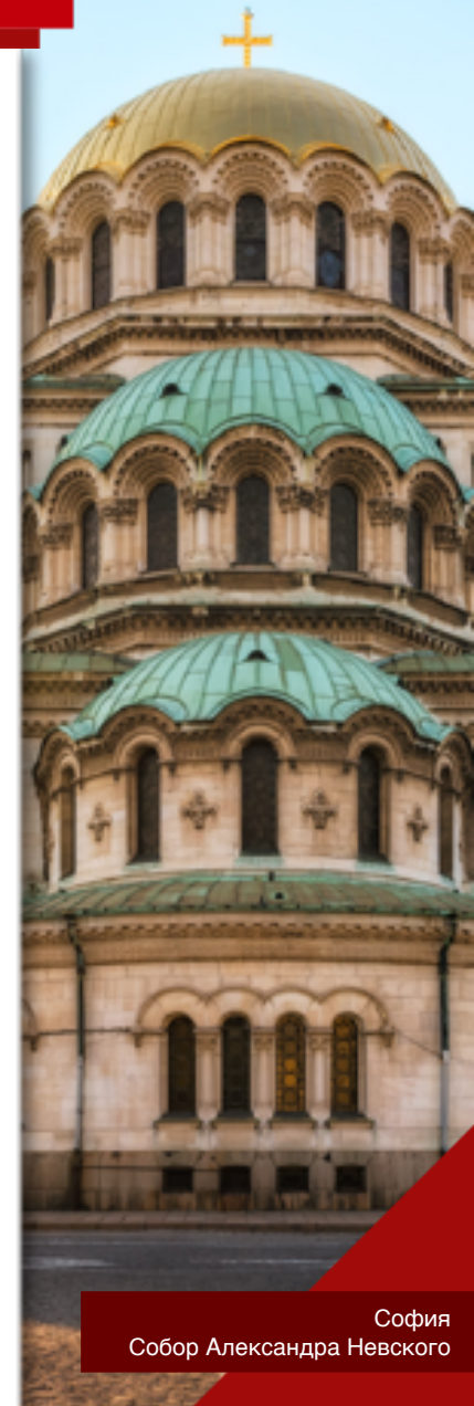
София Собор Александра Невского

17 апреля 1944 г. — «черная пятница»: 350 бомбардировщиков и 100 истребителей союзников сбросили на столицу Болгарии 2 500 бомб. Погибли 128 человек и 69 были ранены.