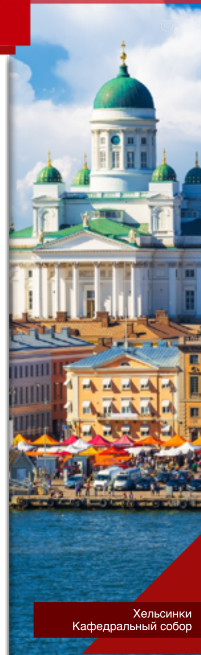
Хельсинки Кафедральный собор

25 апреля 1945 г. — немецкие войска полностью изгнаны с финской территории.