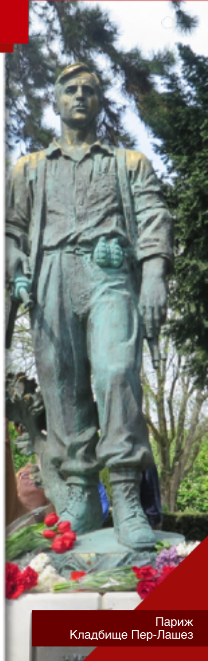
Париж Кладбище Пер-Лашез