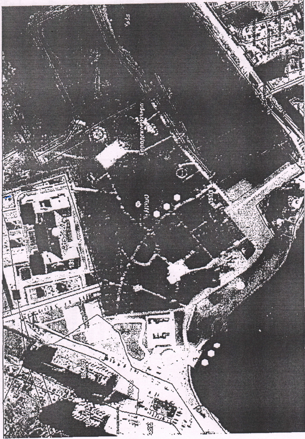
Схема размещения нестационарных объектов (аттракционов) по оказанию услуг на земельных участках, предоставленных в постоянное (бессрочное) пользование муниципальному бюджетному учреждению муниципального образования муниципальный округ город Горячий Ключ Краснодарского края «Городской парк культуры и отдыха 30-летия Победы» (графическая часть)

Приложение 1 к постановлению администрации муниципального образования муниципальный округ город Горячий Ключ Краснодарского края от 16.04.2026 № 435