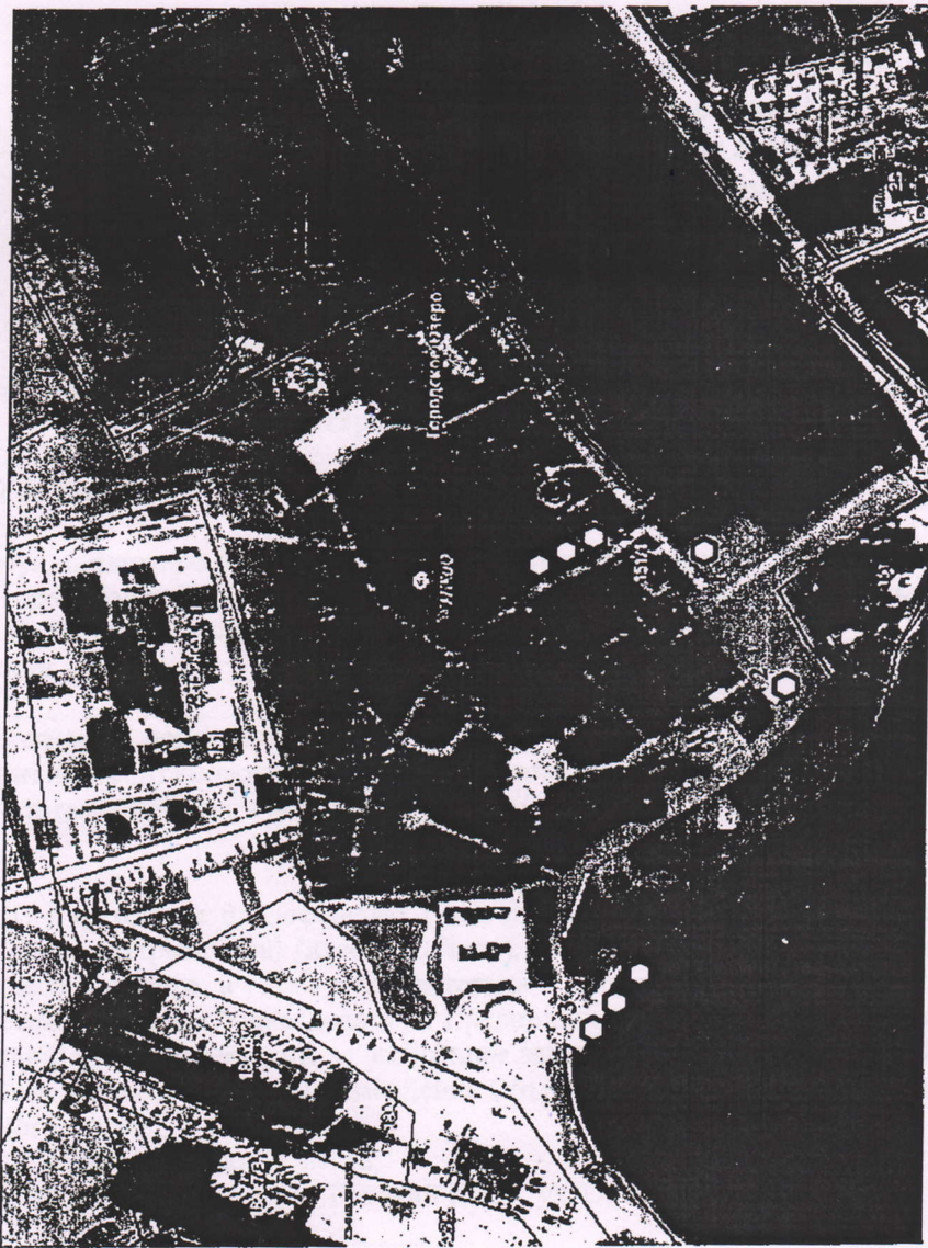
Схема размещения нестационарных объектов (аттракционов) по оказанию услуг на земельных участках, предоставленных в постоянное (бессрочное) пользование муниципальному бюджетному учреждению муниципального образования муниципальный округ Горячий Ключ Краснодарского края «Городской парк культуры и отдыха 30-летия Победы» (графическая часть)

Приложение 1 к постановлению администрации муниципального образования муниципальный округ город Горячий Ключ Краснодарского края от 16.04.2025 № 1343