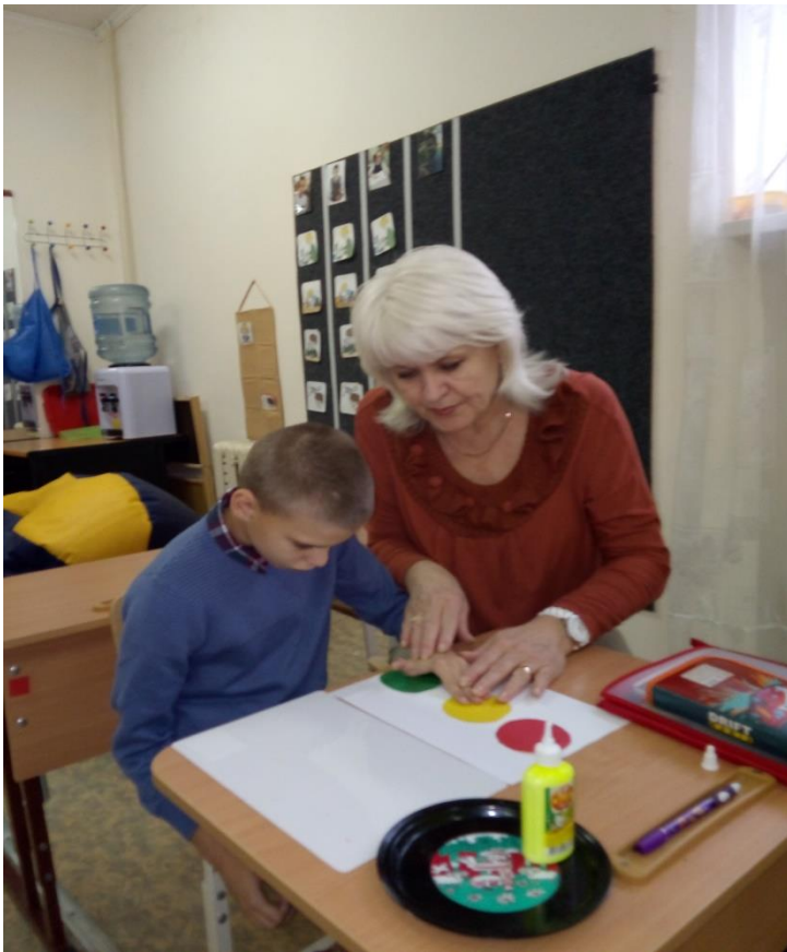
Индивидуальная работа по наклеиванию светофора