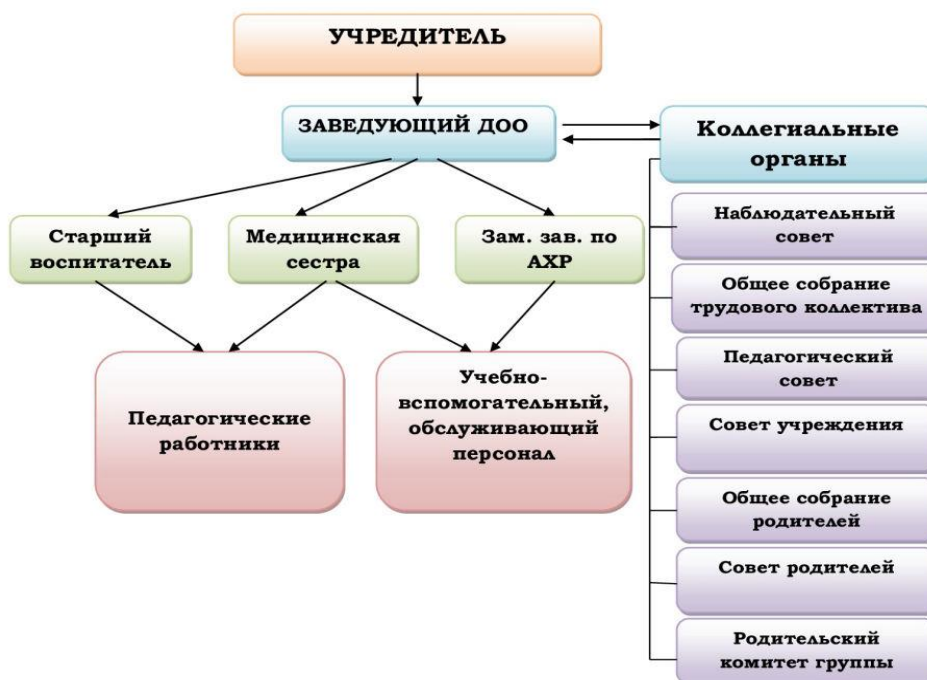
Рис 1. Модель структуры управления в МАДОУ № 29

старший воспитатель, медицинская сестра.