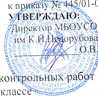
График проведения административных контрольных работ по русскому языку в 4-ем классе