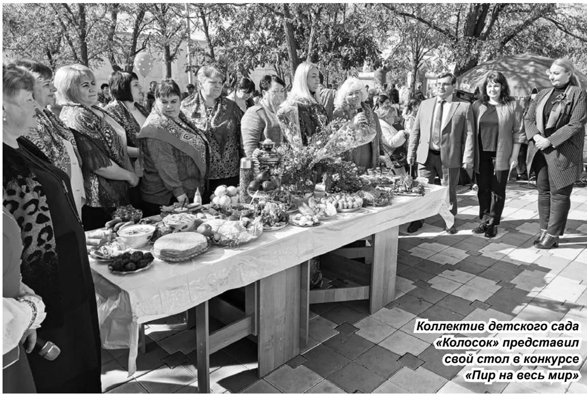
Коллектив детского сада «Колосок» представил свой стол в конкурсе «Пир на весь мир»

ДЕНЬ РОЖДЕНИЯ отметили в светлый праздник Покрова Пресвятой Богородицы с.Нины. К празднику сотрудники его культурно-досугового центра подготовили для жителей и гостей обширную праздничную программу на разных площадках. Началось мероприятие на площади Победы с концертной программы «Моё село, ты - песня и легенда».