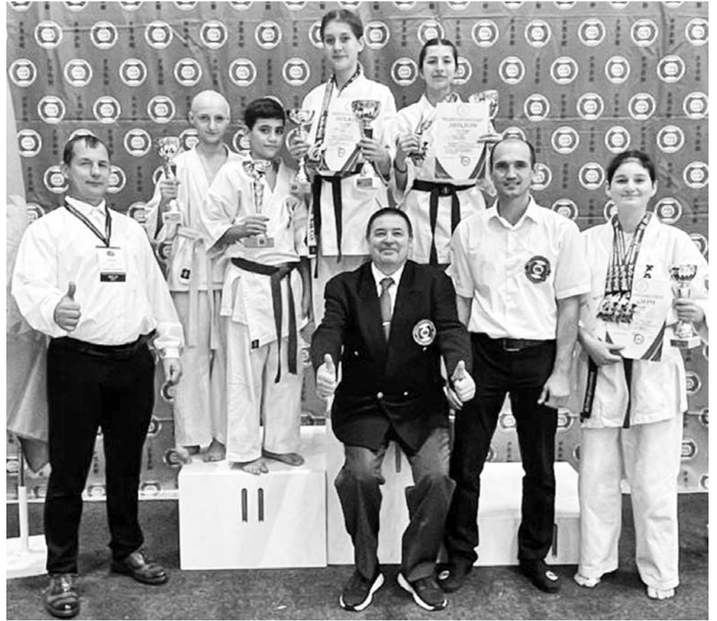
Наши спортсмены показали отличный результат