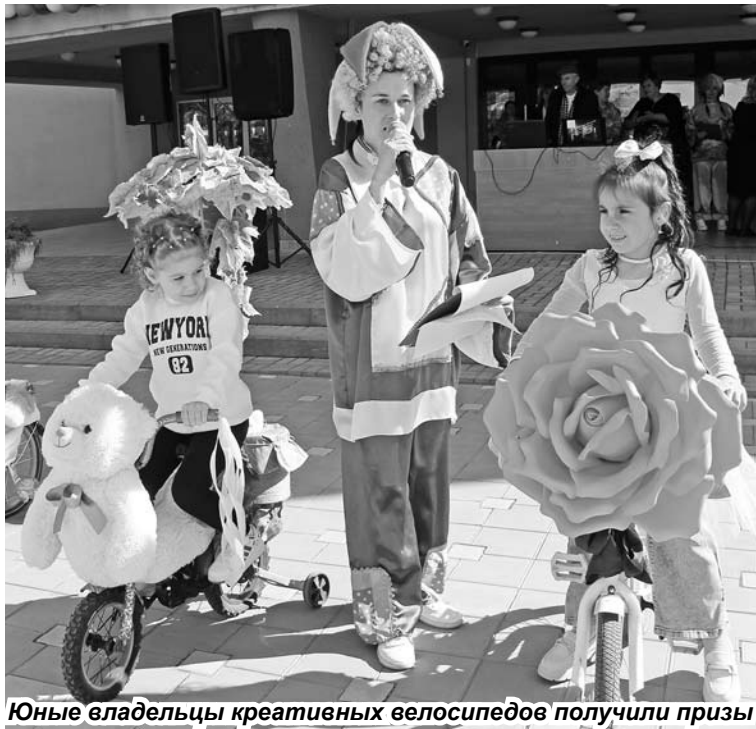
Юные владельцы креативных велосипедов получили призы

ПРАЗДНОВАНИЕ 245-й годовщины основания с.Солдато-Александровского началось с ярмарочного гуляния. В торговых точках предпринимателей села можно было приобрести кондитерские изделия, чай из самоваров, другие вкусности.