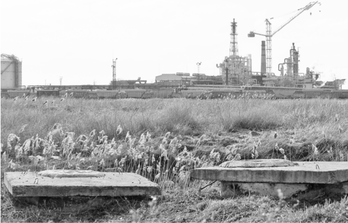
В окрестностях г.Невинномысска возведут экотехнопарк по обработке ТКО

В окрестностях г.Невинномысска разместится экотехнопарк по обработке твёрдых коммунальных отходов и созданию новых товаров из получаемых вторичных ресурсов.