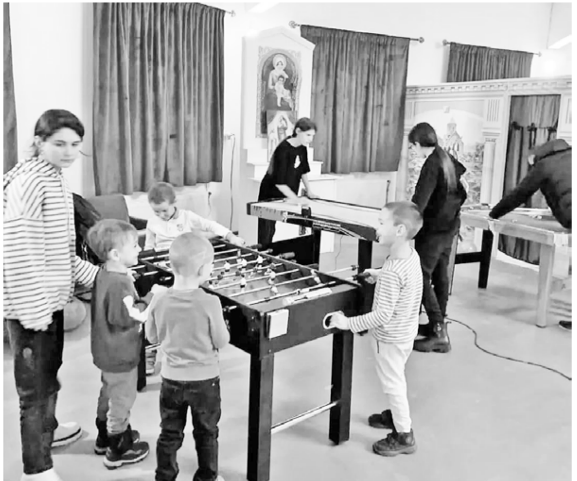
Без игр, веселья не обойтись