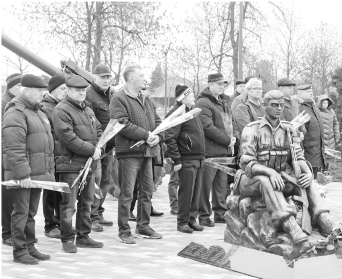
В память о павших в боях была объявлена минута молчания

Во вторник возле памятника защитникам Отечества, погибшим в локальных конфликтах и при исполнении воинского долга, который находится в сквере ДК имени Усанова в г. Зеленокумске, состоялся традиционный митинг. Эта дата связана с выводом теперь уже 33 года назад ограни-