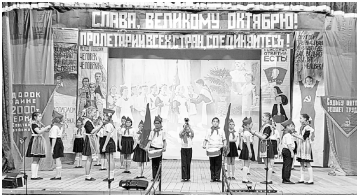
Атмосфера спектакля была радужной и романтической