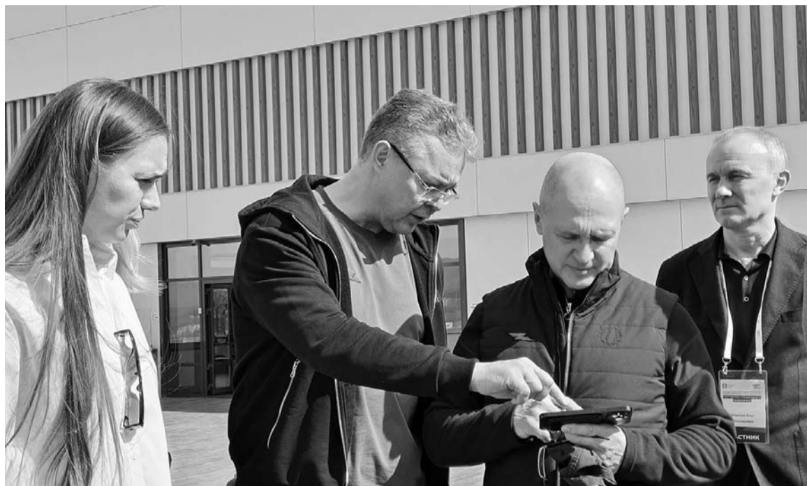
Сергей Кириенко и Владимир Владимиров проинспектировали площадку строительства амфитеатра на «Машуке»