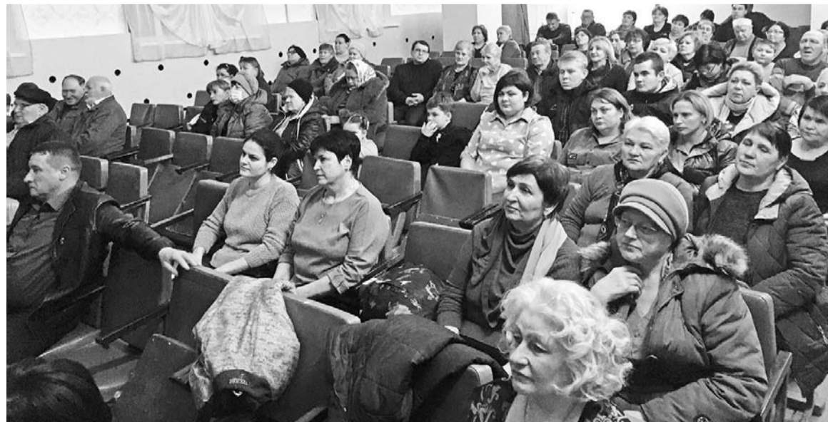
На мероприятие пришли коллеги, ученики, жители п.Селивановка

Г.Тележанина, художественный руководитель ДК п.Селивановка