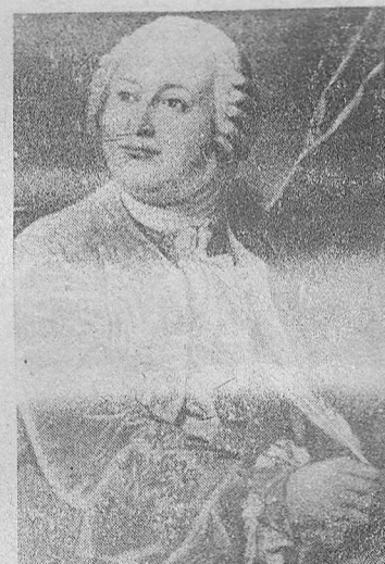
На снимке: Михаил Васильевич Ломоносов.