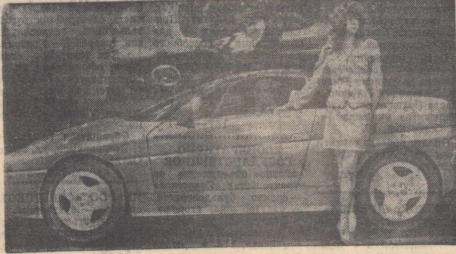
ные решения, постоянно обновлять продукцию.

Международный автомобильный салон прошел в Женеве. Свыше 1000 моделей автомобилей из тридцати стран были представлены на одном из самых престижных в мире парадов автомобилестроения. Среди них — 67 мировых и европейских новинок, впервые выставленных на обозрение широкой публики. Как отмечали специалисты, такого обилия «премьер» еще не было за всю 60-летнюю историю Женевского автомобильного салона. Факт сам по себе закономерный, ибо конкуренция на мировом автомобильном рынке постоянно обостряется, вынуждая конструкторов и дизайнеров искать новые, необыч-