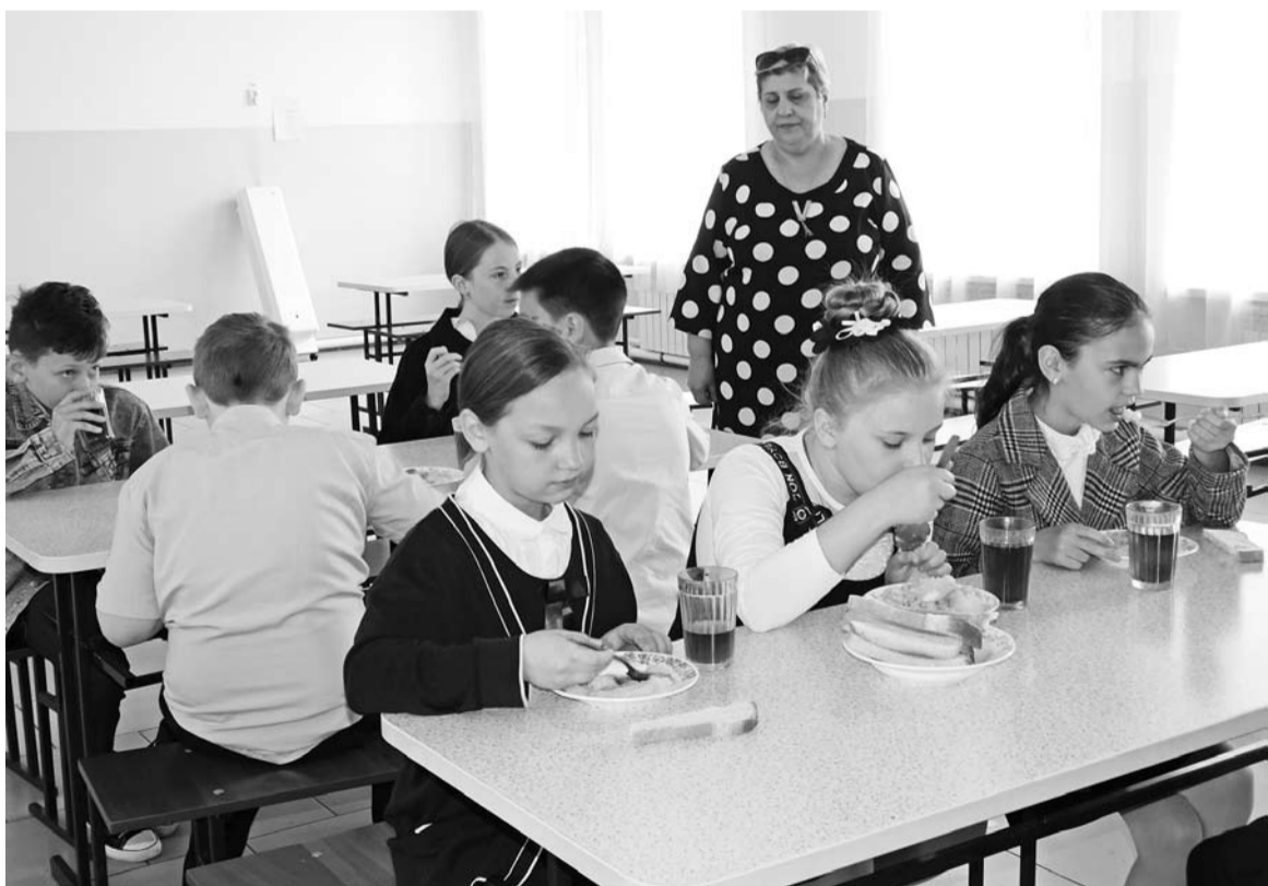
В девять часов утра дети уже завтракали