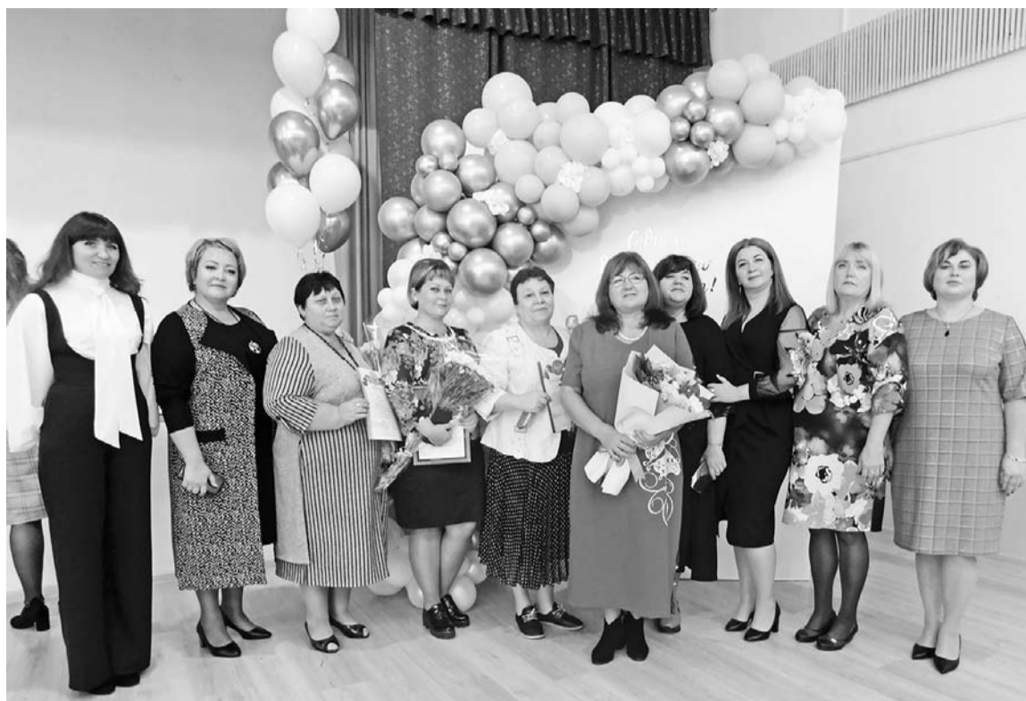
Праздник подарил много положительных эмоций и энергии

Труд дошкольных работников нелёгок. Каких только испытаний не готовит им их профессия! Самое сложное – это высокая степень ответственности за жизнь и здоровье детей, а ещё бесконечная суета, порой незаслуженные обиды от иногда недовольных родителей, невысокая зарплата, не всегда хорошая материальная база дошкольных учреждений, которую их педагоги с золотыми руками компенсируют своими умениями и выдумкой... Но радость от успехов воспитанников, слова благодарности за труд и любовь, терпение и хлоп-