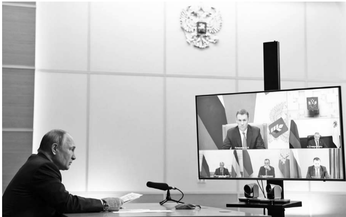
В.Путин: «В России завершается уборка зерновых культур, с 90% площади собрано более 138 млн тонн»

Президент России Владимир Путин провёл совещание, посвящённое развитию российского агропромышленного комплекса. В нём приняли участие главы крупнейших сельскохозяйственных регионов. На обратную связь был вызван губернатор Ставрополя Владимир Владимиров.