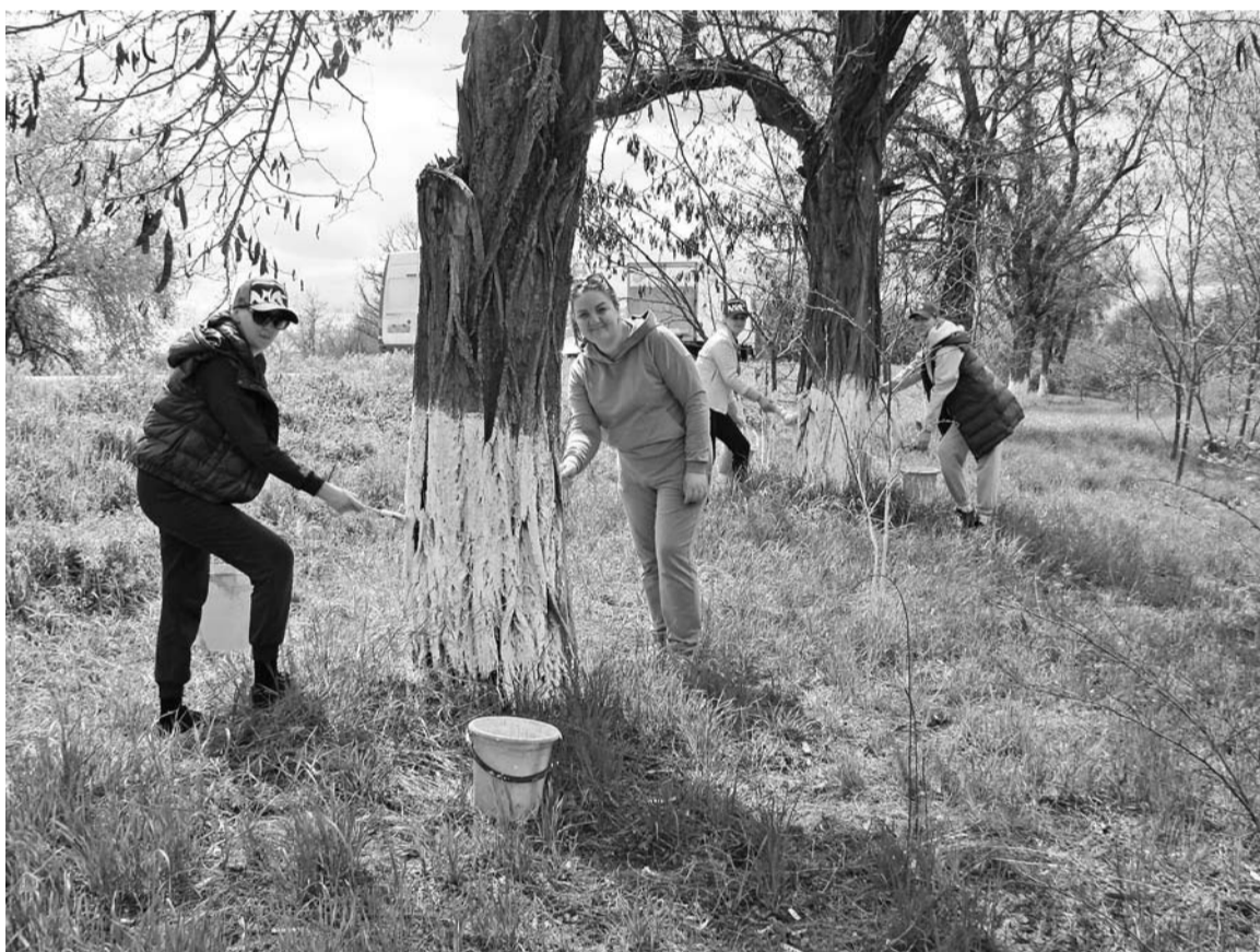
Управление имущественных и земельных отношений администрации

« Город свой мы обожаем, Жить мы в чистоте желаем! Двор свой чисто подметём, На субботник все идём!