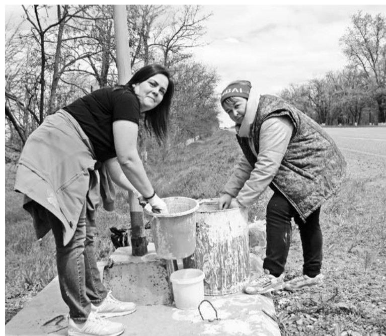
Специалисты управления сельского хозяйства

« Город свой мы обожаем, Жить мы в чистоте желаем! Двор свой чисто подметём, На субботник все идём!