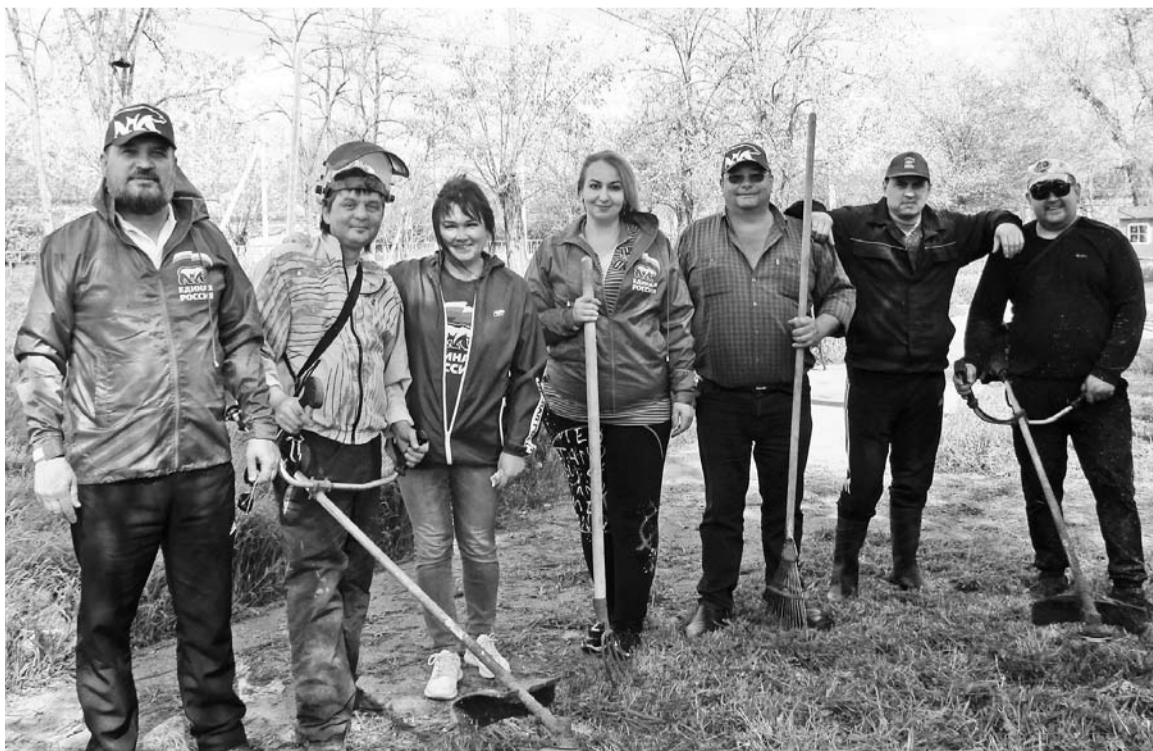
Полосу подготовила Н.МАСЛЕННИКОВА

Депутаты призывают всех земляков найти время и по их примеру выйти на улицы, чтобы навести порядок к майским праздникам около своих дворов и на улицах, а предпринимателей и трудовые коллективы просят обратить внимание на территории около их офисов и зданий. Внешний вид города и поселений – в наших руках!