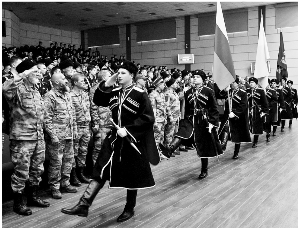
Бойцам казачьей бригады «Терек» были вручены госнаграды: три ордена Мужества и семь медалей «За отвагу»