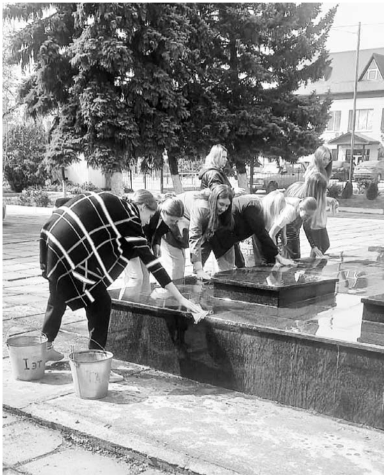
Учащиеся СОШ №6 отмыли плиты мемориала

« Грабли в руки мы возьмём, И посёлок приберём! Эй, народ, не подведи, На субботник выходи!