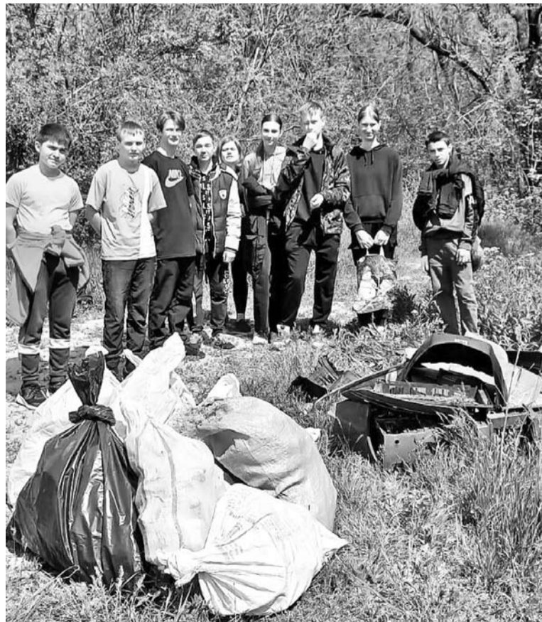
Около 400 кг мусора собрали по берегам Кумы

Фото и информацию предоставил теротдел администрации СГО в с. Нины