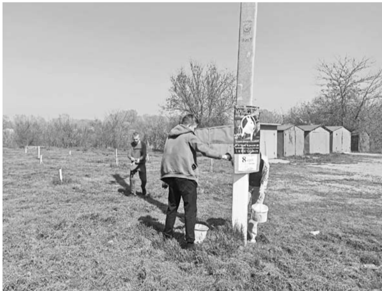
Сад Памяти приведён в порядок

« Если ты человек реальный, Сделай двор свой идеальным! Город станет краше всех! Гарантируем успех!