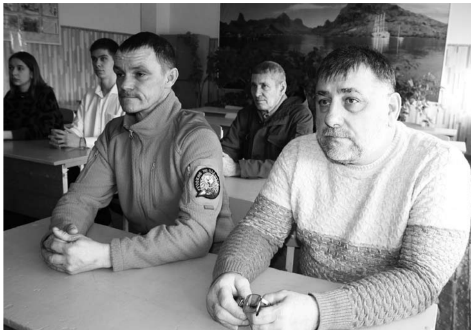
Бойцы на встрече в казачьем классе средней школы №10