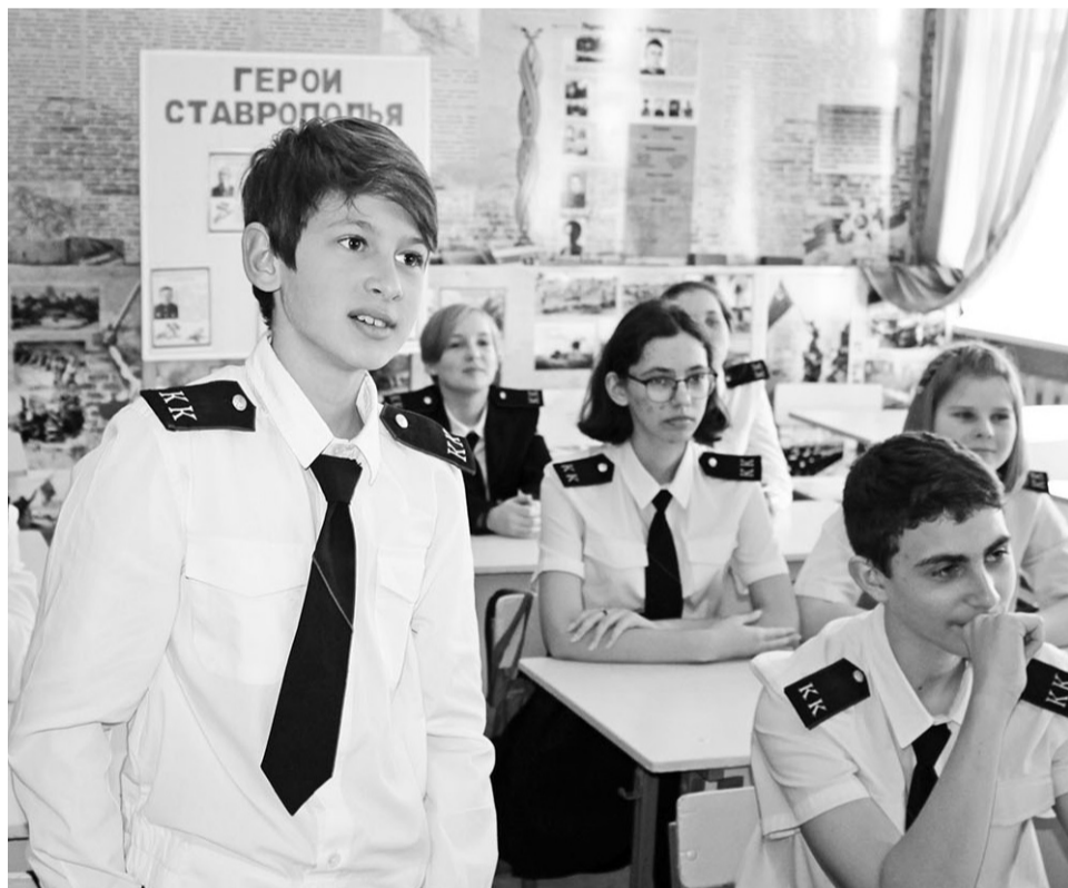
У казачат много вопросов к защитнику Отечества

Ф.Пилугин, с.Солдато-Александровское Фото автора