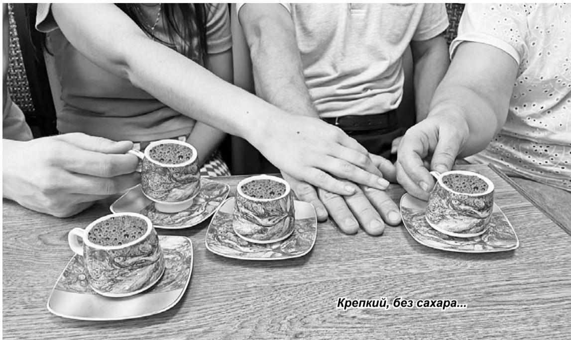
Крепкий, без сахара...

совещание с заведующими отделами и поехал на соревнования в надежде развеяться. Но и там мысли о семье не шли из головы.