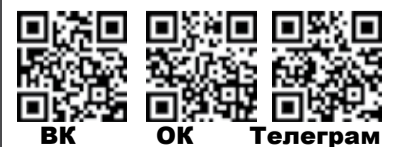
Фото и видео здесь:

Новый храм сможет принять до 300 человек. Он будет представлять собой православный культурно-просветительский центр. Вместе с открытием библиотеки и воскресной школы для детей и взрослых здесь появятся возможности для развития социальных программ, место для репетиций хора, проведения пастырских бесед, приходских собраний, церковных и культурных мероприятий.