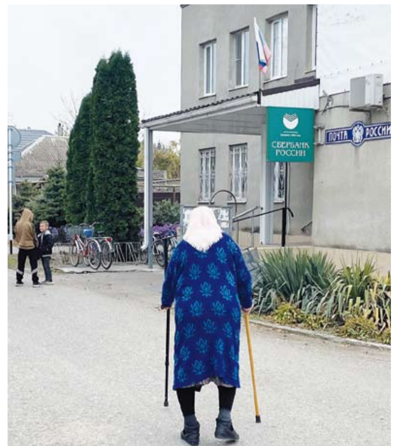
Вот так добираются до места выдачи пенсии пожилые жители с.Горькая Балка, чтобы получить её и газеты. Путь этой женщины занял не один час

Итак, с хорошим начинанием всех нас! В добрый путь!