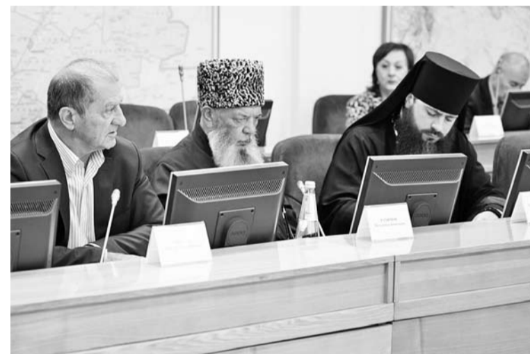
Участники заседания совета при губернаторе Ставропольского края по вопросам межэтнических отношений сошлись во мнении, что платформой для сохранения единства общества должна стать общегражданская идентичность

Актуальные аспекты межэтнического и межконфессионального взаимодействия на Ставрополье обсудили на заседании совета при губернаторе Ставропольского края по вопросам межэтнических отношений. Его провёл глава региона Владимир Владимиров.