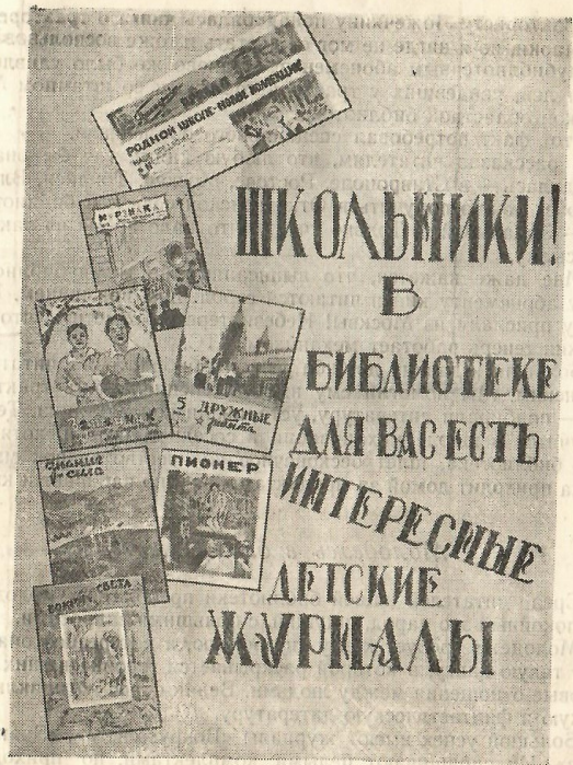
Плакат для школьников

Я открываю книгу и начинаю читать ее вслух. Естественно, слушают все, оказавшиеся в библиотеке. И парень заснул. Я обрываю чтение.