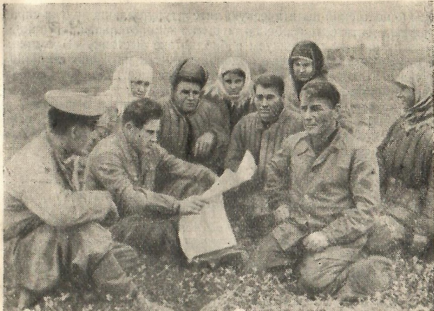
Громкое чтение газеты в тракторной бригаде

За два месяца в бригаде 23 раза проведено коллективное чтение. Прочитаны произведения С. Бабаевского «Свет над землей», М. Бубеннова «Белая береза», П. Ангелиной «Люди колхозных полей» и многие другие.