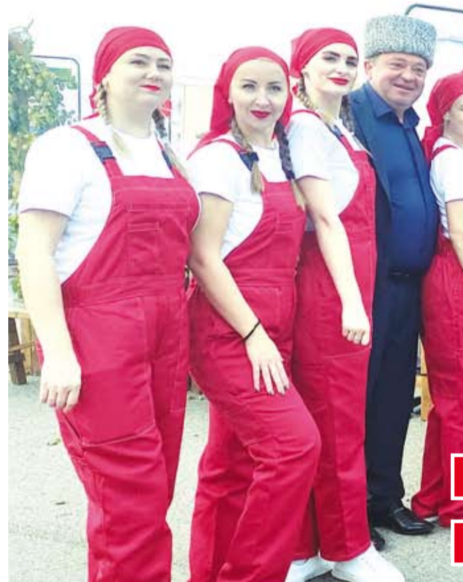
Земляки-участники масштабного праздника в г.Миха

30 СЕНТЯБРЯ Ставрополье отмечало День урожая. В масштабном празднике, развёрнутом на территории выставочного комплекса города Михайловска Шпаковского района, приняли участие труженики сельскохозяйственной отрасли из всех районов края и гости из других регионов. На праздник приехала также делегация из Луганской Народной Республики.