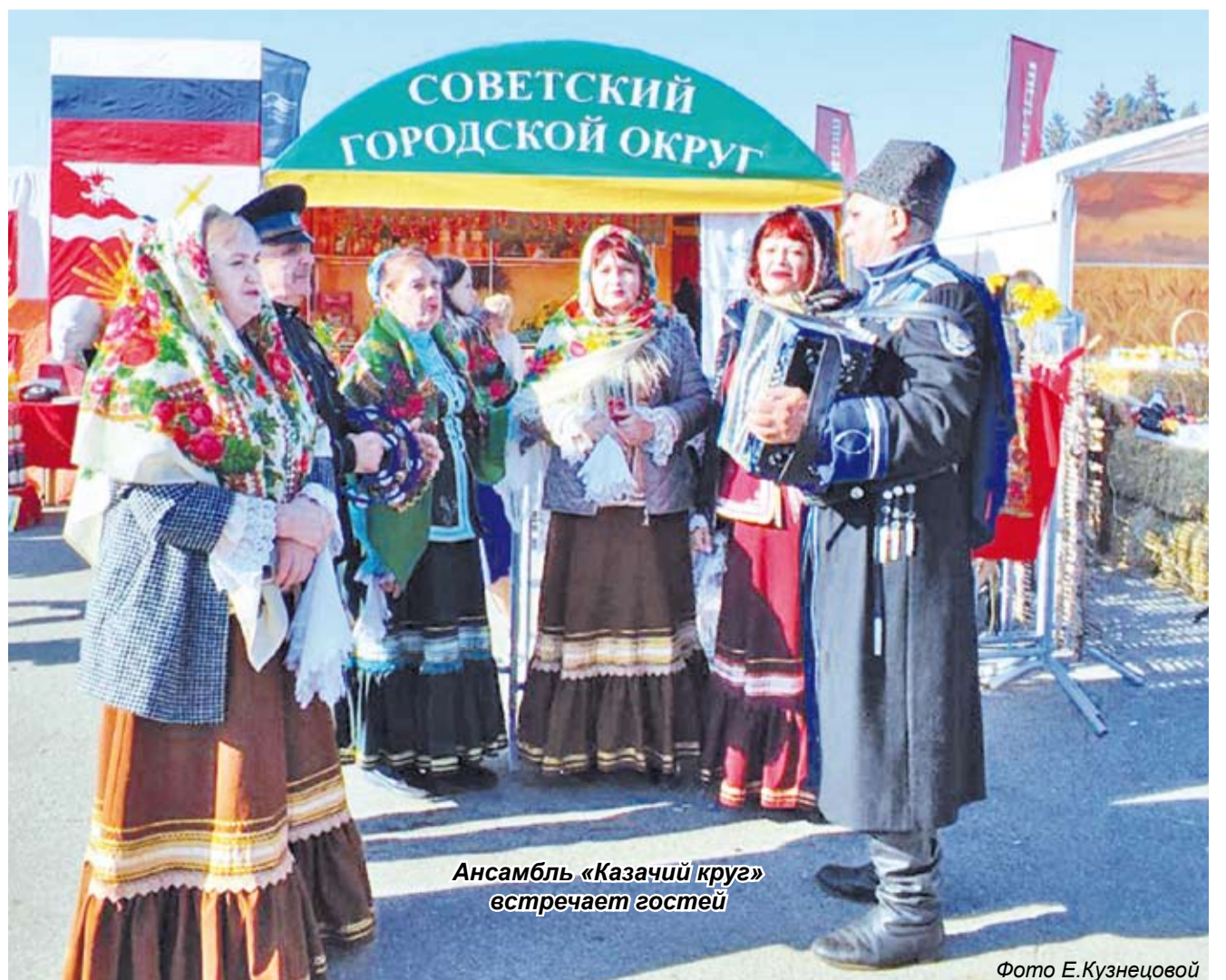
Ансамбль «Казачий круг» встречает гостей