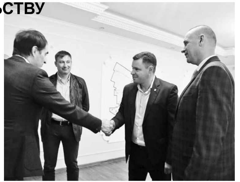
Рабочая встреча с представителями завода и застройщика