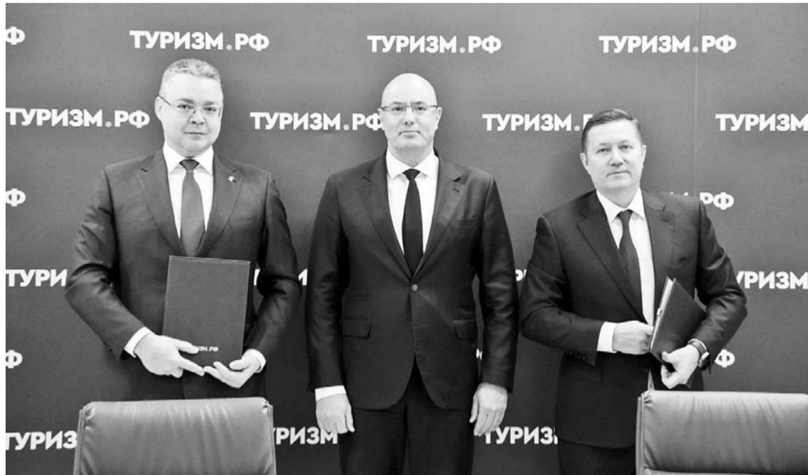
Владимир Владимиров: «Корпорация Туризм.РФ» обеспечит новый приток инвестиций на Ставрополье»