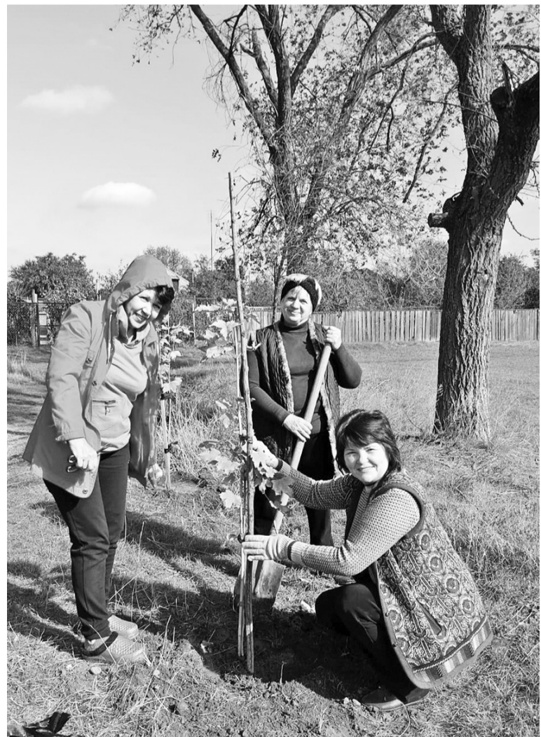
Теперь в с.Нины есть аллея клёнов выпускников 1984 года

Администрация Советского городского округа Ставропольского края в соответствии со ст. 39.18 Земельного кодекса Российской Федерации извещает о возможном предоставлении в аренду сроком на 20 лет земельного участка из земель населённых пунктов, не имеющего самостоятельного значения, для индивидуального жилищного строительства с кадастровым номером 26:27:062603:21, площадью 443 кв.м, местоположение: Ставропольский край, Советский район, г.Зеленокумск, переулок Крымский, 11.