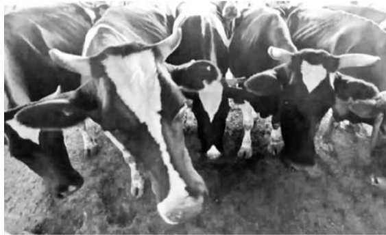
В крае страхование сельхозживотных с господдержкой в 2022 году выросло в 1,5 раза

Таким образом, объём страхования сельхозживотных с господдержкой в 2022 году по числу голов в крае вырос в полтора раза.