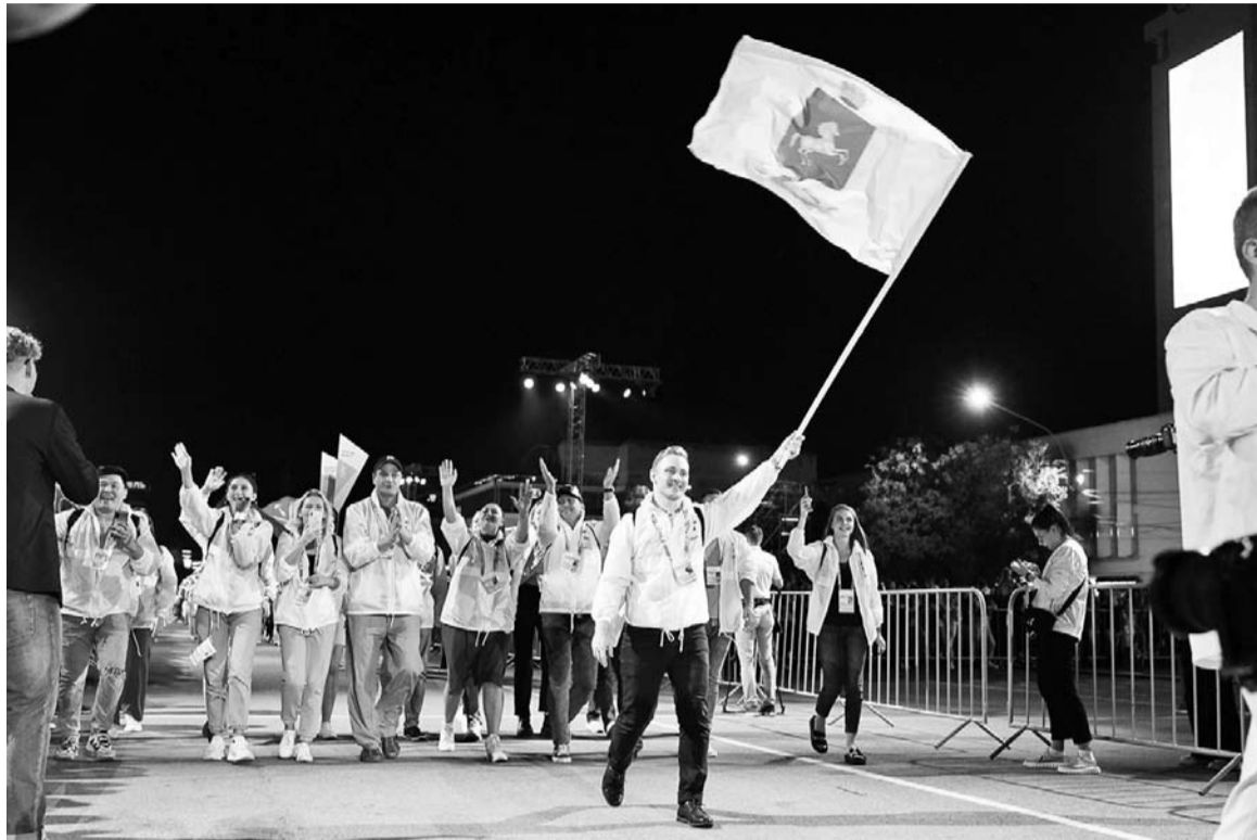
В форуме приняли участие более 2 тысяч человек из 61 региона РФ, а также делегации из ЛДНР