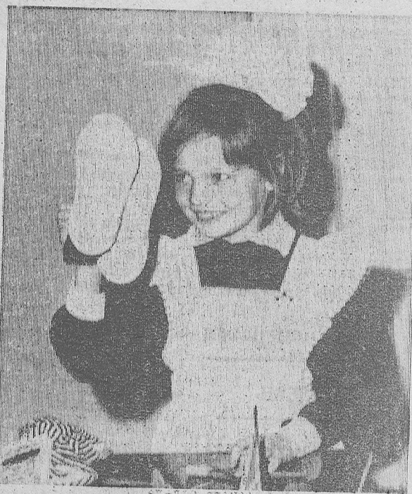
В музыкальной школе Зеленокумска недавно прошла викторина, фрагмент которой вы видите на фотографии нашей постоянной автора Вадима ШАРОВА.