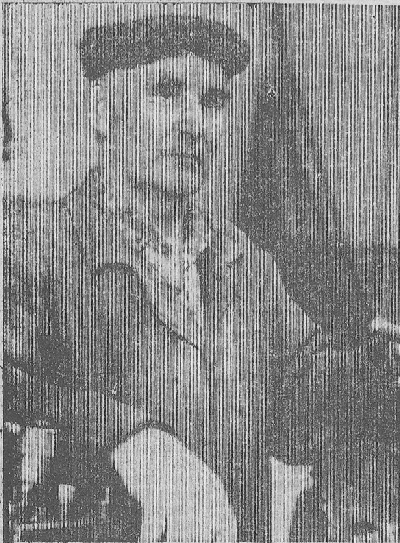
Проблемы вечерней школы