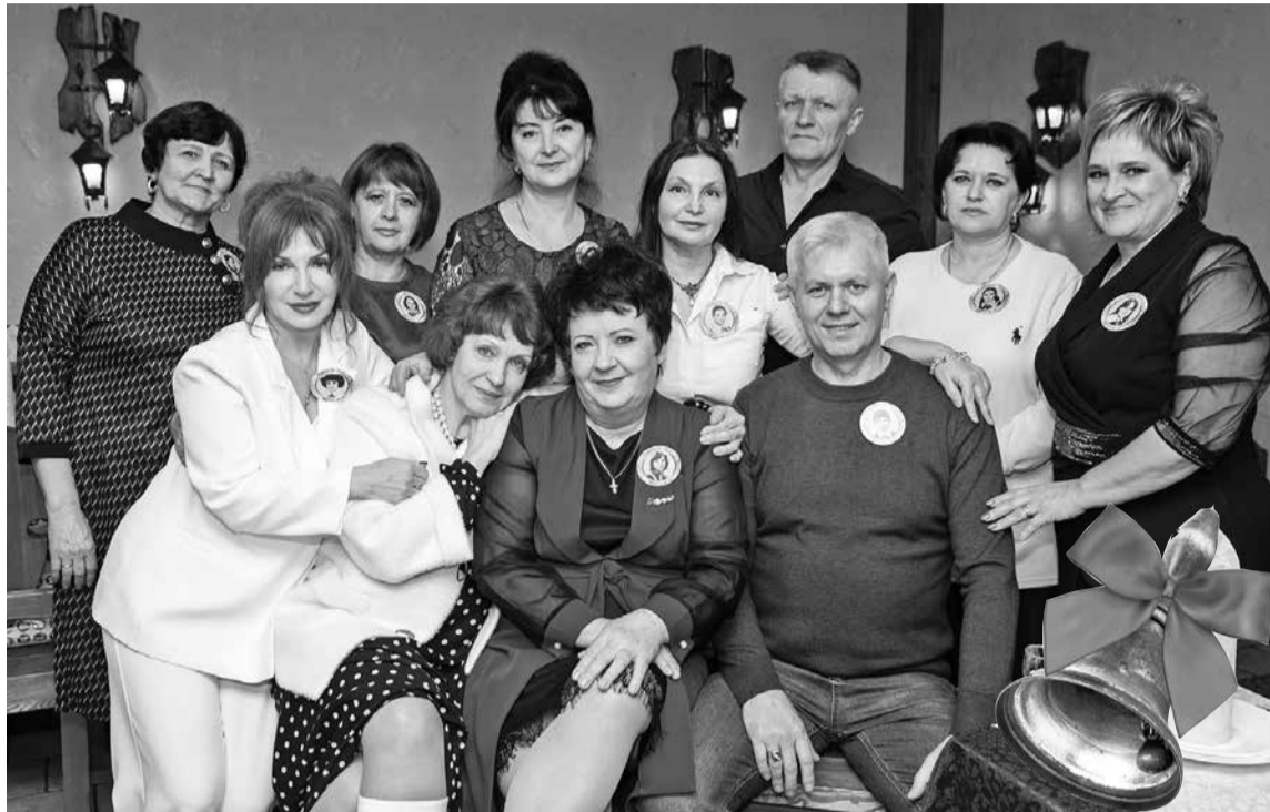
Солидные мальчики и бойкие девочки 1984 года выпуска

Традиция. В первую субботу февраля прошли встречи с одноклассниками