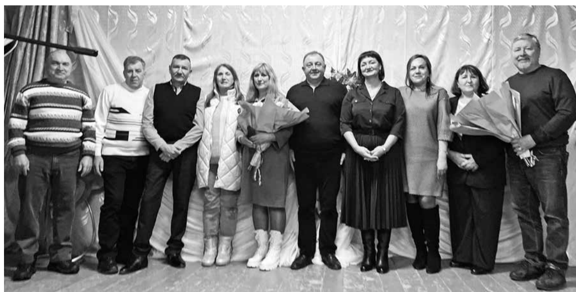
Самый старший выпуск на вечере

В конце вечера по традиции все исполнили песню «Одноклассники» и дали друг другу слово встретиться в следующий юбилей. А затем, как водится, все отправились в кафе, чтобы за общим столом вспомнить школьные годы чудесные, рассказать о днях сегодняш-