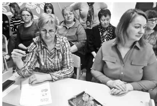
Учителя школ округа с учениками проводят эксперименты по химии.