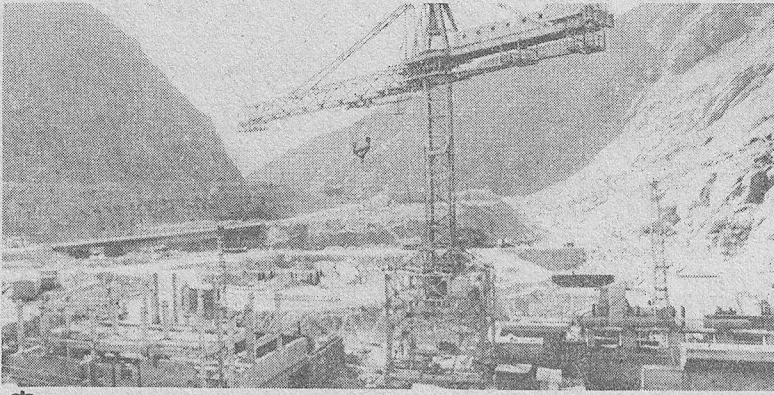
Факт и комментарий