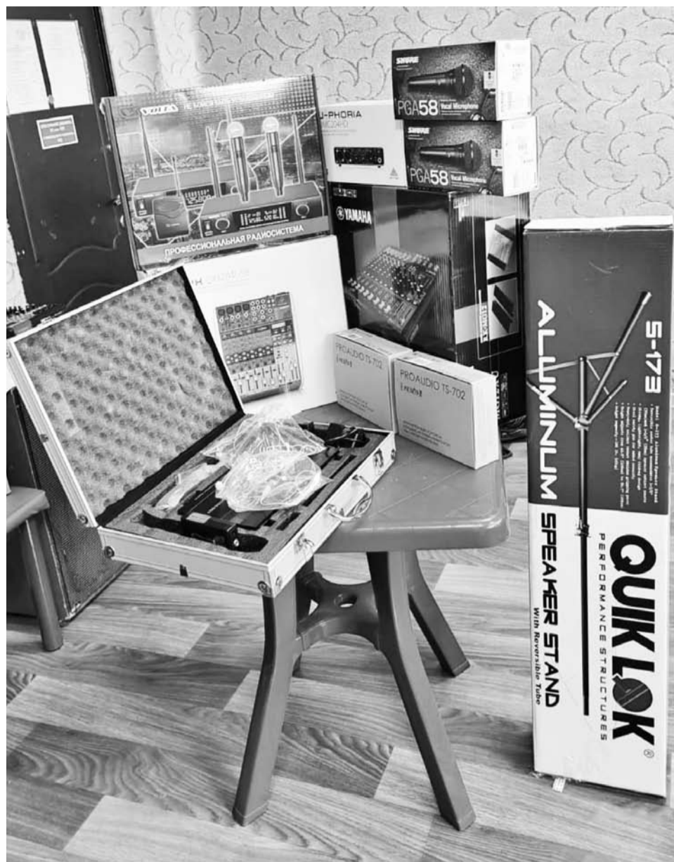
Новое оборудование приобретено в рамках проекта «Культура малой Родины»

Т.Штода, администратор Зеленокумского городского СКО