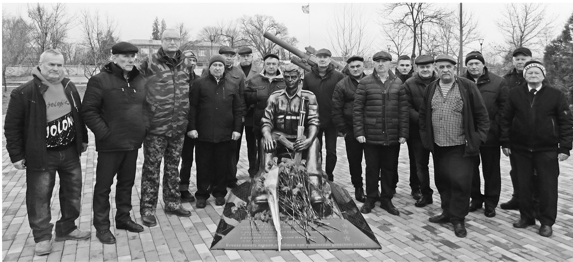
Войны-интернационалисты отдали дань памяти погибшим соотечественникам

Событие. Отдали дань памяти землякам-участникам военных конфликтов