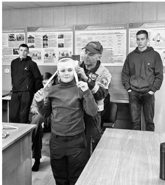
На занятиях «Секции А» воспитанники изучают основы оказания первой медицинской помощи