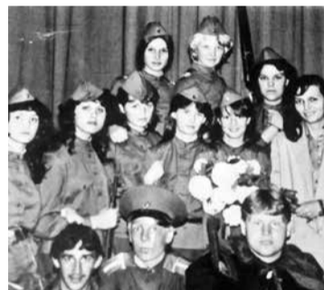
После спектакля «А зори здесь тихие». Зеленокумск, 1985 г.