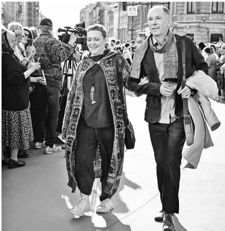
На красной дорожке кинофестиваля «Виват кино России!» с актрисой Хельгой Филипповой. г.Санкт-Петербург, 2023 год