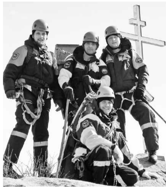
Группа спасателей ПАСС СК из Ессентуков во время тренировок в горной местности

Мне очень нравится работать спасателем! Даже смертельная усталость - не повод для уныния, когда понимаешь смысл, видишь результат своей работы, благодарные лица тех, кому помог в трудной ситуации.