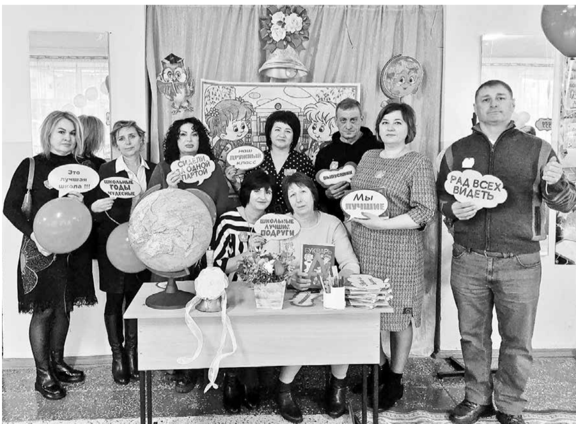
Выпуск 1989 года