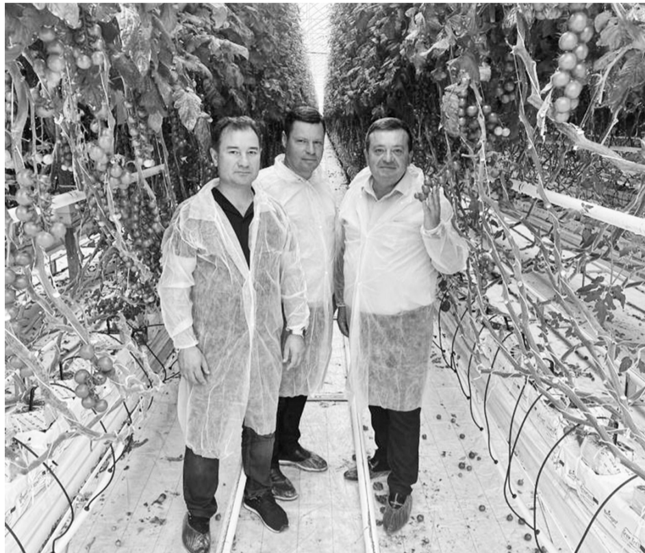
Основную долю инвестиций в экономику округа направило ООО СХП «Кавказ», выращивающее томаты

Малый бизнес - важнейший сектор экономики округа. Он во многом определяет темпы экономического роста, структуру и качество валового продукта, участвует в формировании местного бюджета, способствует созданию конкурент-