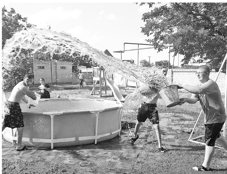
Радость присутствующих, особенно детей, была безгранична