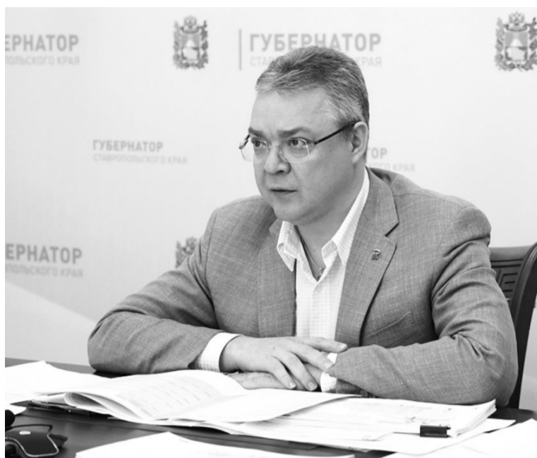
На Ставрополье в 2023 году будут капитально отремонтированы 89 медучреждений

— Сегодня на Ставрополье мы планируем приобретение модульных конструкций фельдшерско-акушерских пунктов для сельских территорий. Появление новых ФАПов — залог получения своевременной медицинской помощи для людей. Задача по реализации программы ложится в том числе на глав территорий и главных вра-