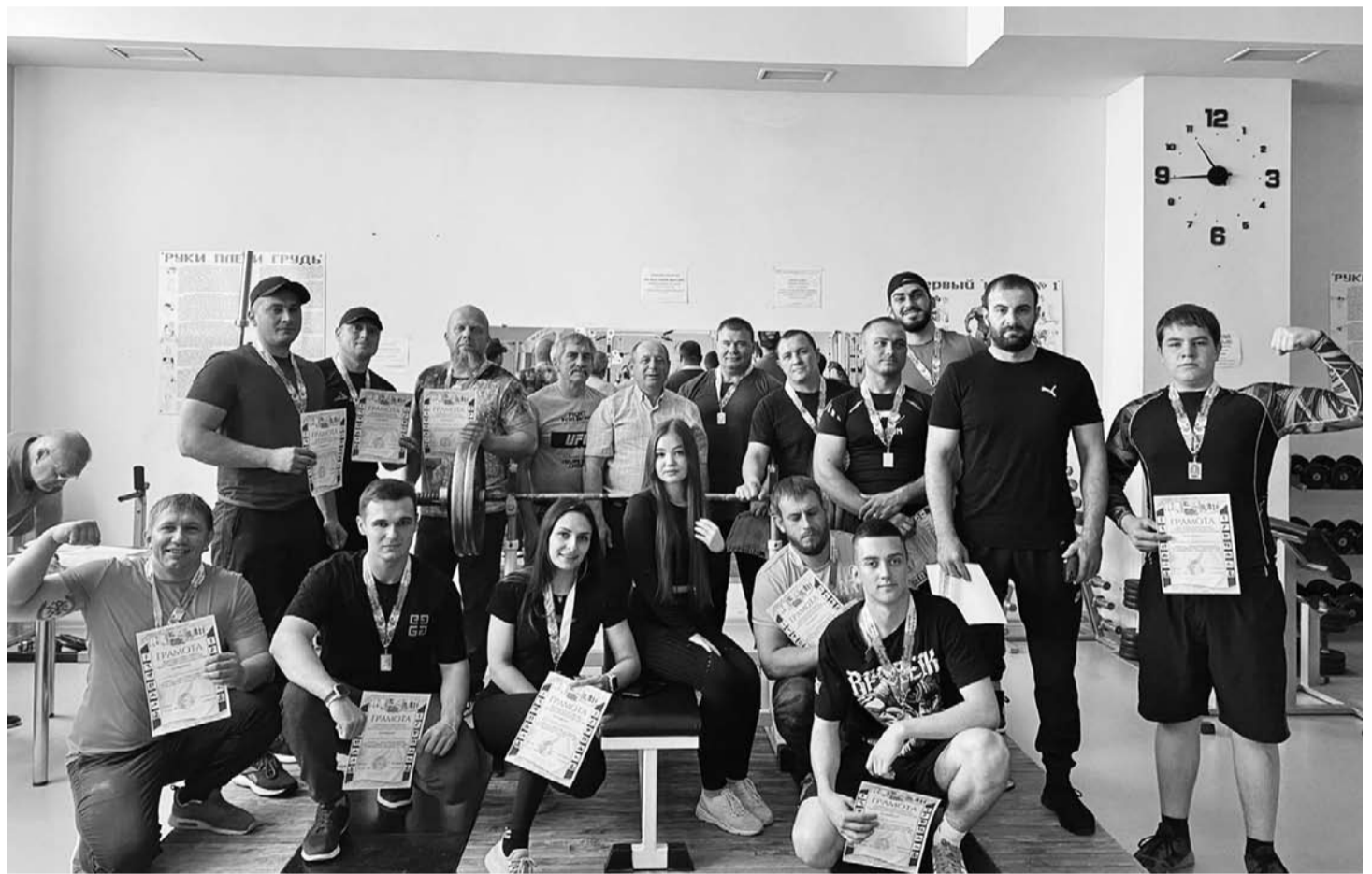
Силу демонстрировали мужчины и женщины, юноши и девушки