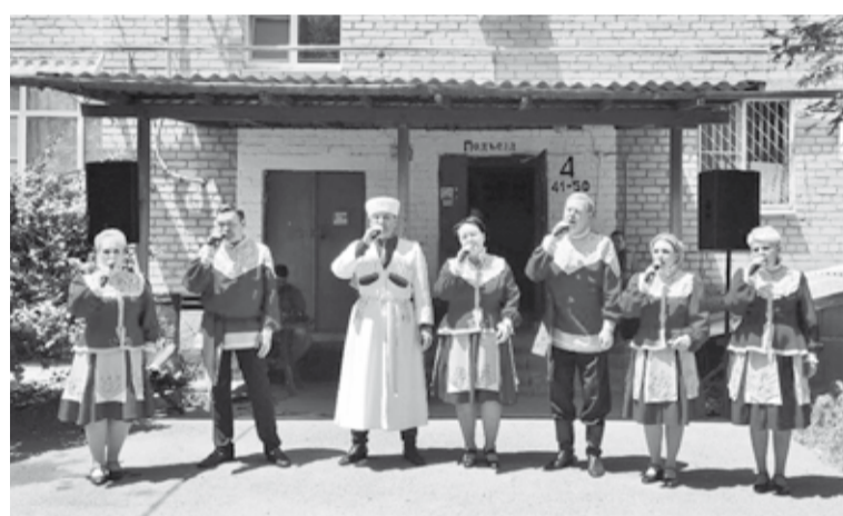
В рамках акции «Разная, но единая» состоялись концерты под открытым небом музыкальных коллективов нашего района

Сотрудники центра культуры и досуга с.Горькая Балка приняли участие в марафоне добрых и важных дел. В рамках акции «Делаю Россию Лучше» они провели уборку территории на ме-