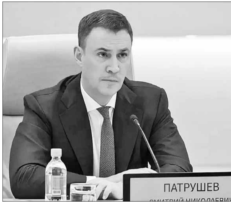
Дмитрий Патрушев в ходе совещания.

Он также подчеркнул, что география экспорта охватывает более 160 государств, причём 90% объёма направляется в дружественные