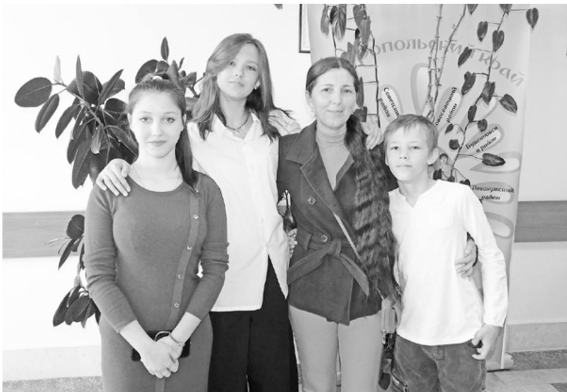
Каждый перенёс прививку по-разному