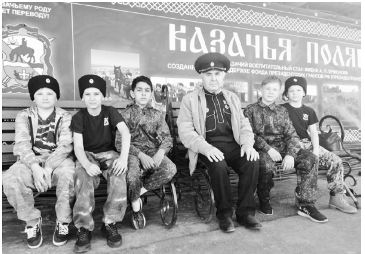
Здесь на бесплатной основе занимаются спортом и конной выездкой местные дети