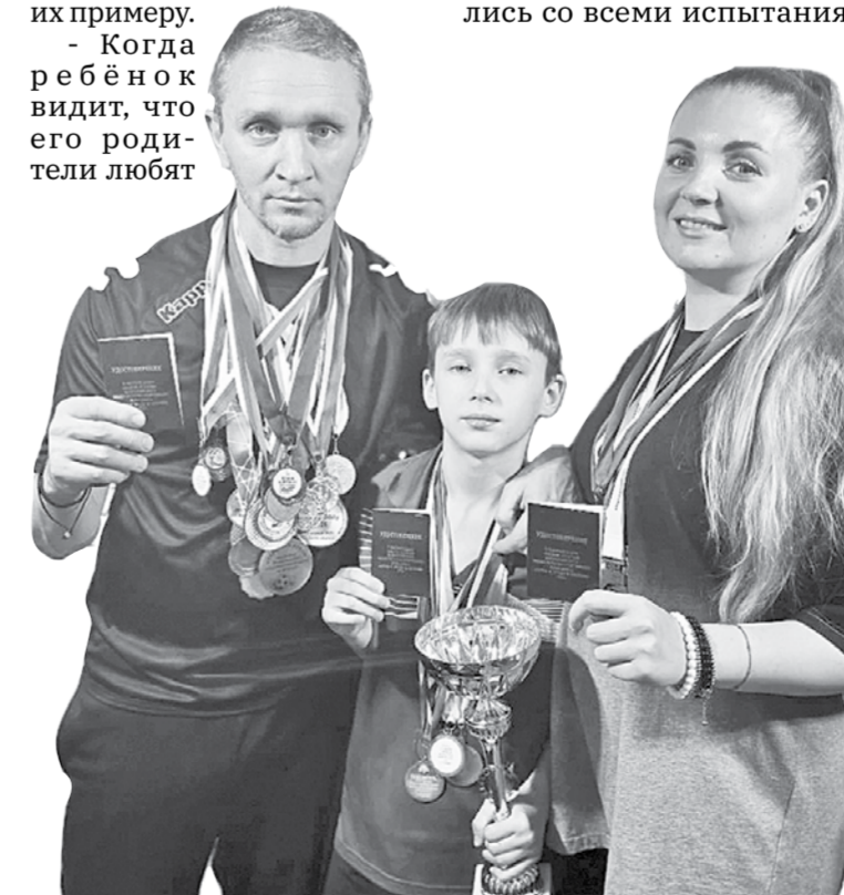
Семья Бритик из Зеленокумьска в полном составе сдали нормы ГТО на золотые значки.

- Когда ребёнок видит, что его родители любят