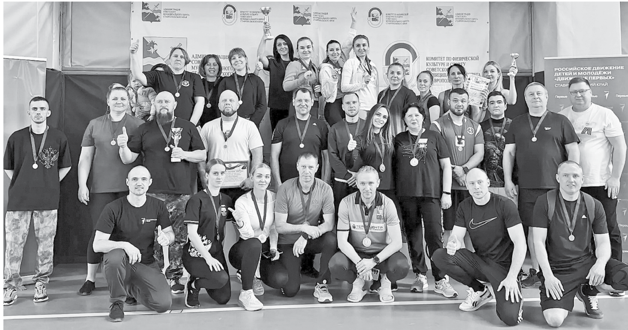
Победители и призёры окружного юбилейного спортивного фестиваля «Готов к труду и обороне».

ду и обороне» возрождает традиции советских времён, но с нынешним акцентом на здоровье и мотивацию. Комплекс включает в себя 18 возрастных ступеней ГТО - от дошкольников (6-7 лет) до пожилых (70+). Каждая из них имеет обязательные тесты на выносливость, силу, скорость и гибкость, плюс добавляются испытания по выбору участника.