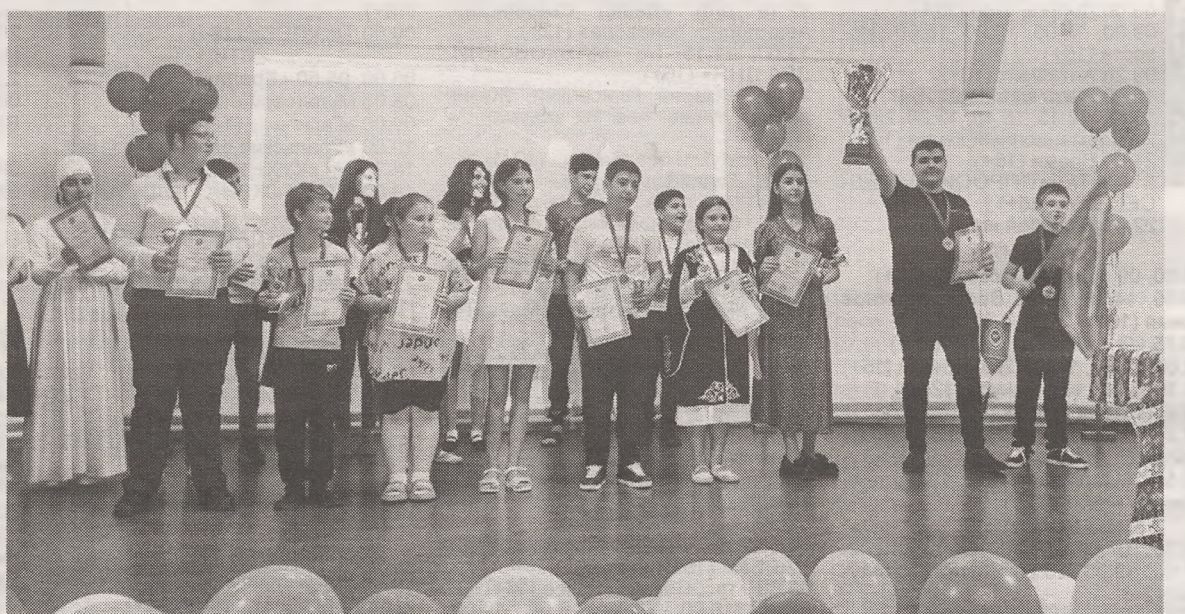
Награждение команды «Арцах»

танцевали до позднего вечера. В зале царил просто невероятная атмосфера радости и гордости за наших ребят!