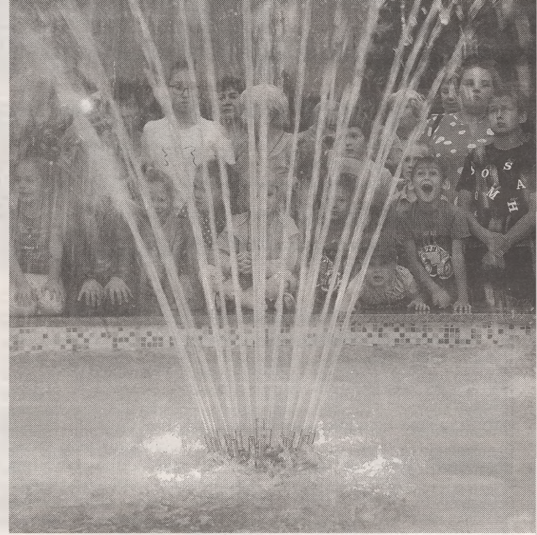
В день открытия

дальнейшее участие в них наших земляков.