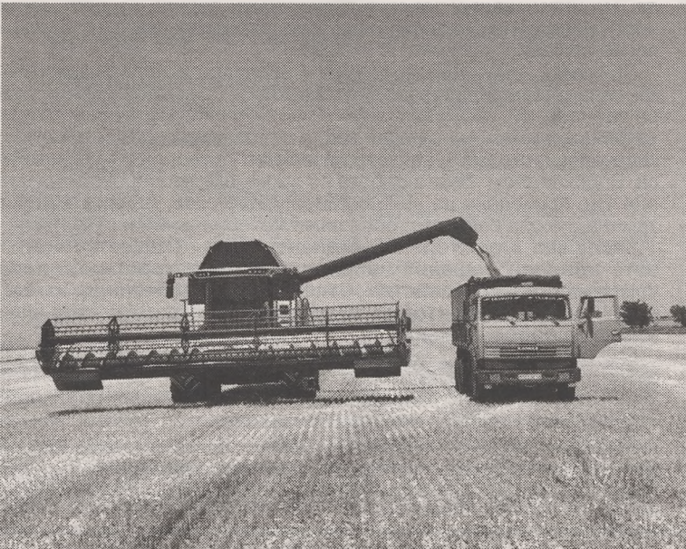
На Ставрополье собран первый миллион тонн зерна нового урожая

Напомним, губернатор края дал поручение краевому минсельхозу разработать региональную программу по развитию семеноводства на ближайшие пять лет. Она станет одним из важнейших шагов к повышению конкурентоспособности сельского хозяйства края и решению поставленной Президентом РФ задачи импортозамещения.