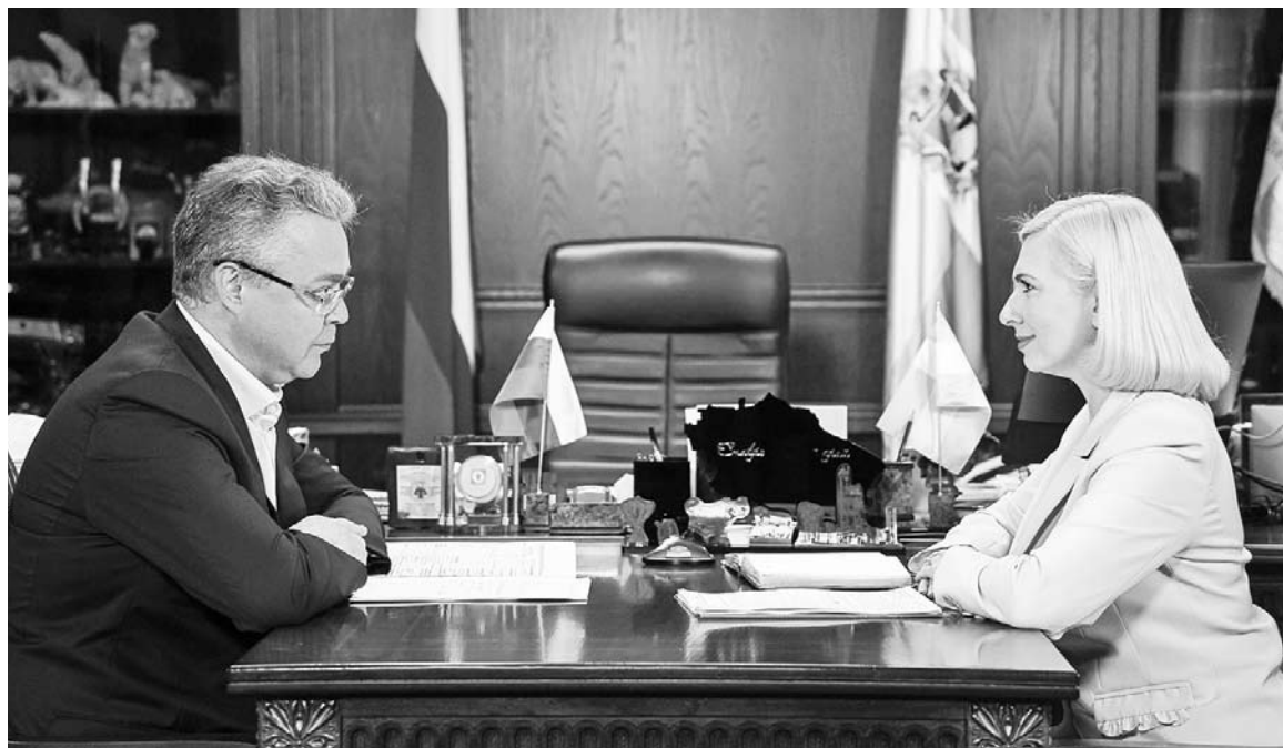
Губернатор В.Владимиров поставил задачу обеспечить доступность очного обучения в центре «Сириус» для детей из всех территорий края