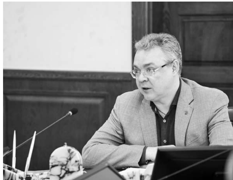
В.Владимиров: Задача власти – помочь волонтерам в их деятельности.

Губернатор Владимир Владимиров провёл заседание координационного совета по развитию добровольчества и социально ориентированных НКО на Ставрополье.