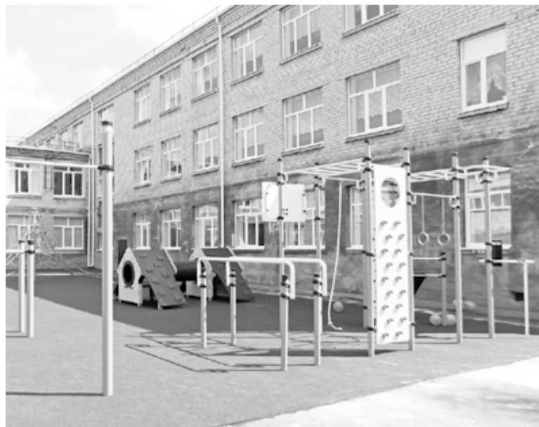
Общий вид спортивного комплекса