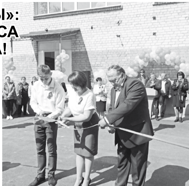
Самый торжественный момент

Далеко не все руководители предприятий чувствуют ответственность за населённый пункт, в котором сами работают, за тех