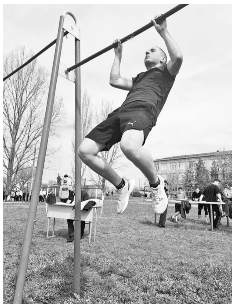
Подтягивание на перекладине - задание не из лёгких

«Смотрю на вас и радуюсь за сильных, прямых и неsgiбаемых людей! Как много у тебя, моя Россия, таких вот сыновей и дочерей», - эти строчки прозвучали во время церемонии открытия спартакиады. И очень хочется, чтобы они стали отражением ис-