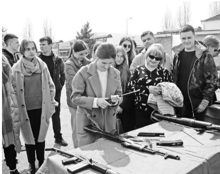
Оружием заинтересовались и девушки