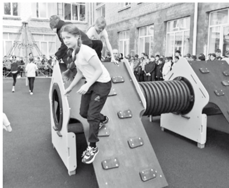
Школьники прямо во время линейки опробовали новые спортивные приспособления

людей, что трудятся и живут на земле, за их детей. Но жителям Отказного повезло: коллектив во главе с председателем не остаётся равнодушным к насущным проблемам села, смотрит далеко вперёд. И есть надежда, что в него и в колхоз вернутся те, кто сейчас пока на школьной ска-