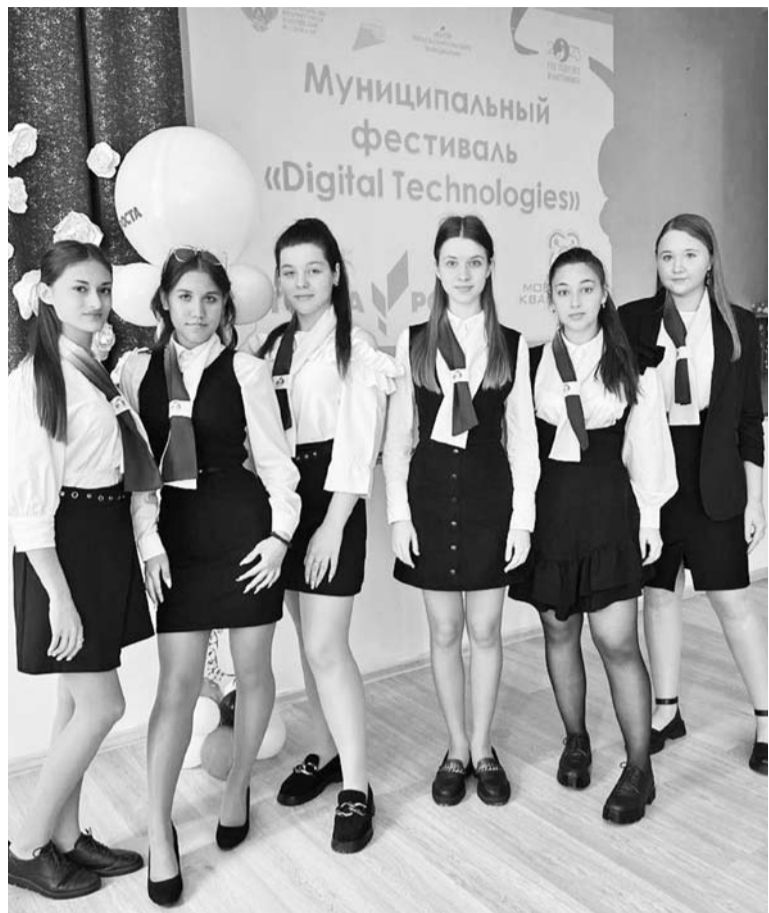
Десятиклассницы СОШ №2 помогли модераторам проектов

«Панорама» последовательно рассказывала о мероприятиях первых двух сессий, а на третьей была проведена экскурсия для учащихся 3-х и 4-х классов в хай-тек-мастерские для практических занятий с использованием высокотехнологического оборудования. Ребятам показали лазерный гравёр и показали работы учащихся, выполненные на станке. Также подвели итоги деятельности школьников и молодых педагогов.