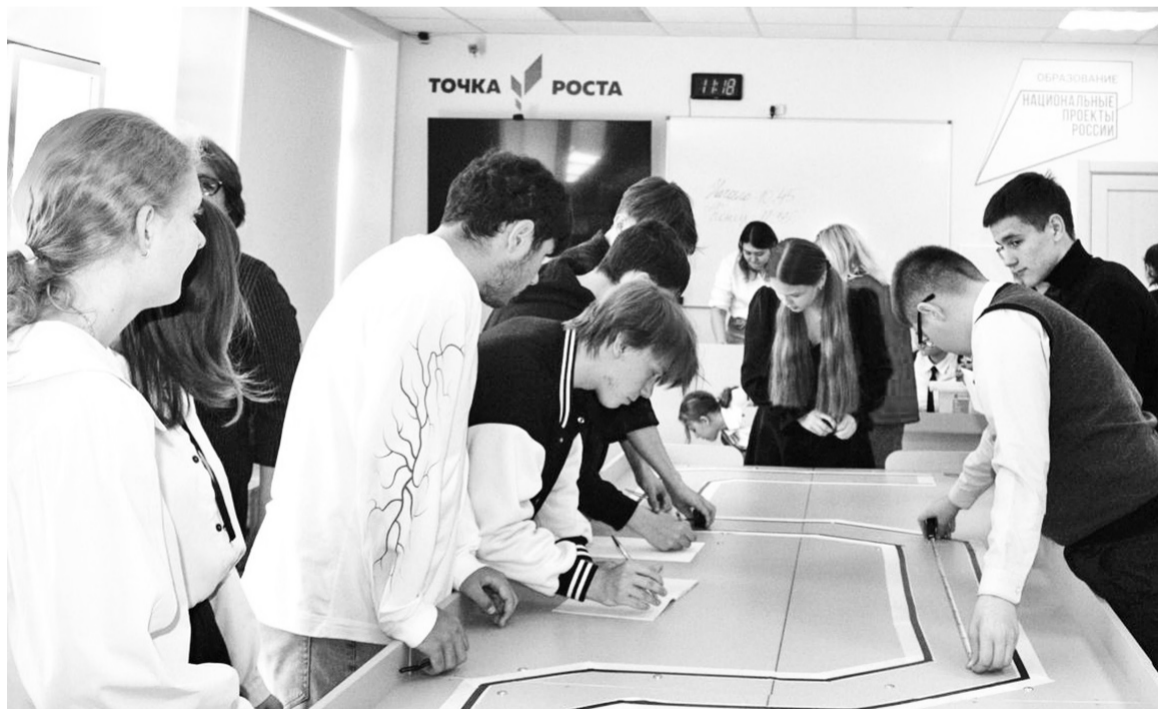
Представители всех команд оценивают прохождение роботом трека