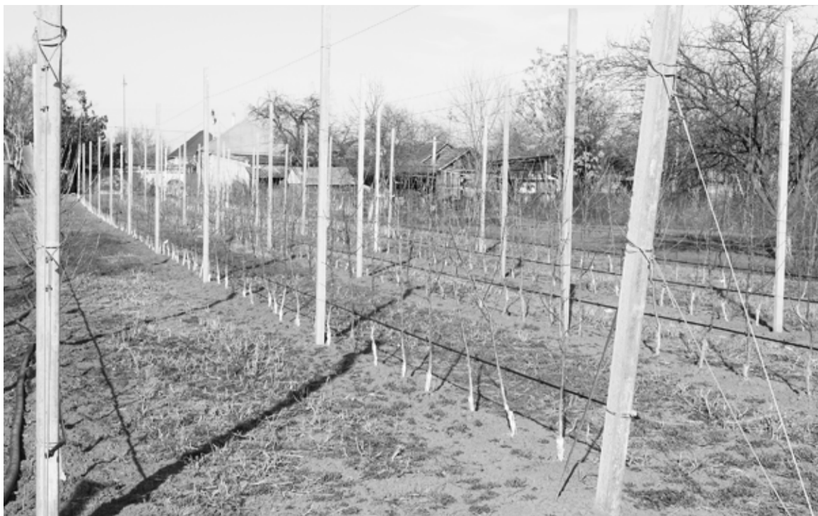
Разбили участок и заложили яблоневый сад на шпалерах с капельным орошением

Уход за интенсивным садом – дело хлопотное и трудоёмкое. Ему нужно уделять постоянное внимание, все необходимые обработки должны быть своевременными и систематическими,