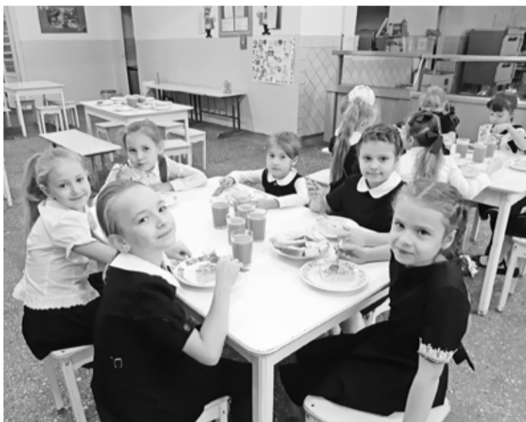
Самые благодарные поклонники таланта повара

Всегда в белоснежном халате и шапочке, с улыбкой на лице она появляется на своём рабочем месте, чтобы творить настоящие чудеса. Команда её соратников также достойна величайших похвал.