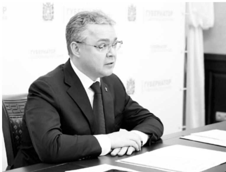
Губернатор Ставрополья поручил проработать меры поддержки краевой экономики в условиях введённых санкций

На Ставрополье будет проведён анализ экономической ситуации и в случае необходимости разработан план поддержки предпринимательства.