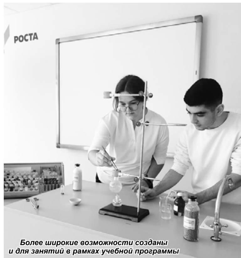
Более широкие возможности созданы и для занятий в рамках учебной программы

Разумеется, «Точка роста» в СОШ №6, как и в других школах района, продолжит своё развитие: планируются поставки и другого современного обо-