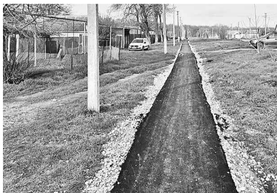
Тротуар по улице Горького в п.Михайловке.

В бюджете округа изыскали более 4,2 млн рублей на масштабный проект по строительству полноценного тротуара длиной 1,5 км. Новая пешеходная зона стала важным шагом к повышению качества жизни в селе. Теперь жители смогут добраться до социально значимых объектов не по грязи и не опасаясь автомобилей.