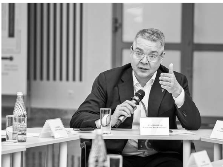
Владимир Владимиров: «Ставрополье активно использует возможности искусственного интеллекта»

Дизайн-сессию посетил губернатор Владимир Владимиров. Он оценил выработанные в ходе мероприятия предложения по цифровизации экономики и социальной сферы края. В ходе дискуссий были определены лучшие проекты и перспективные направления внедрения цифровых технологий