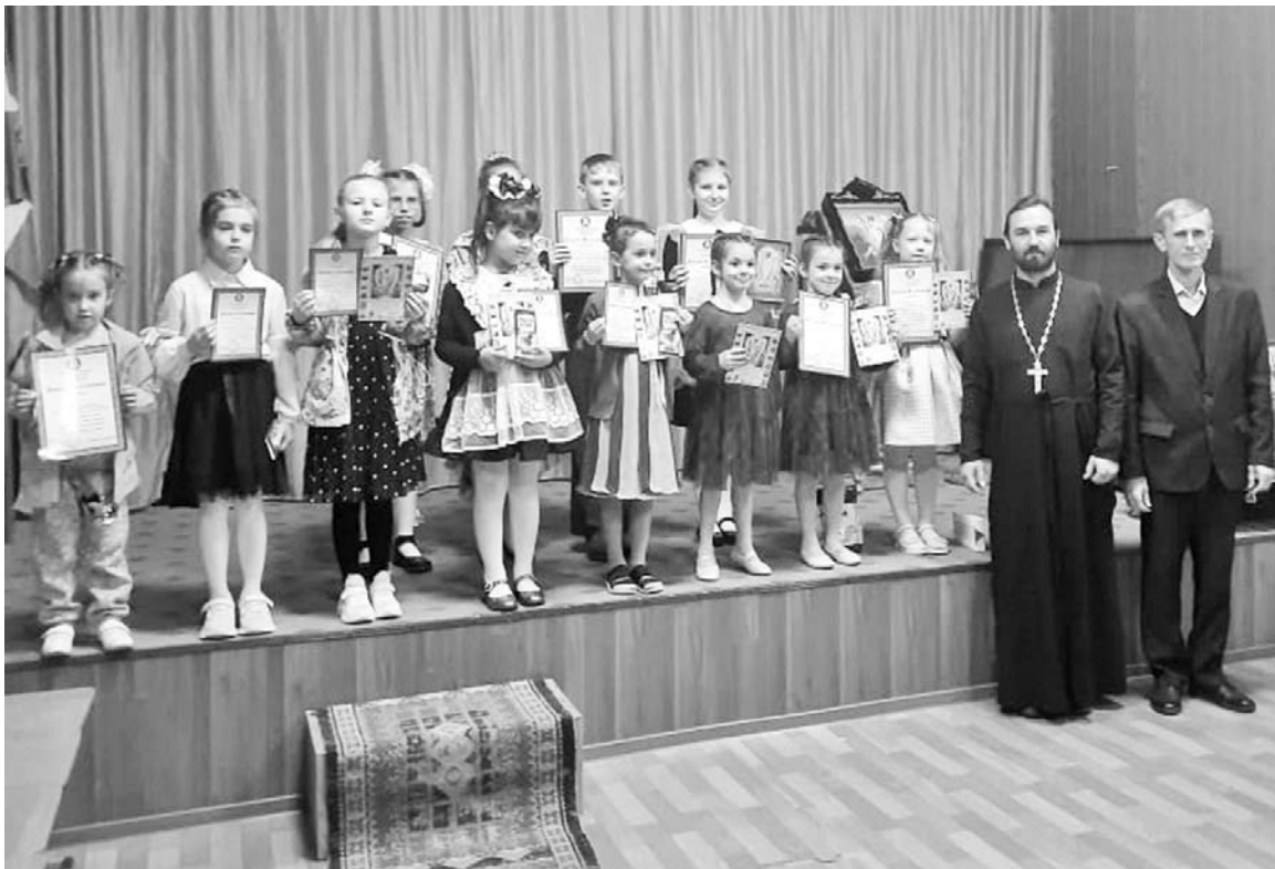
Награждение самых маленьких участников