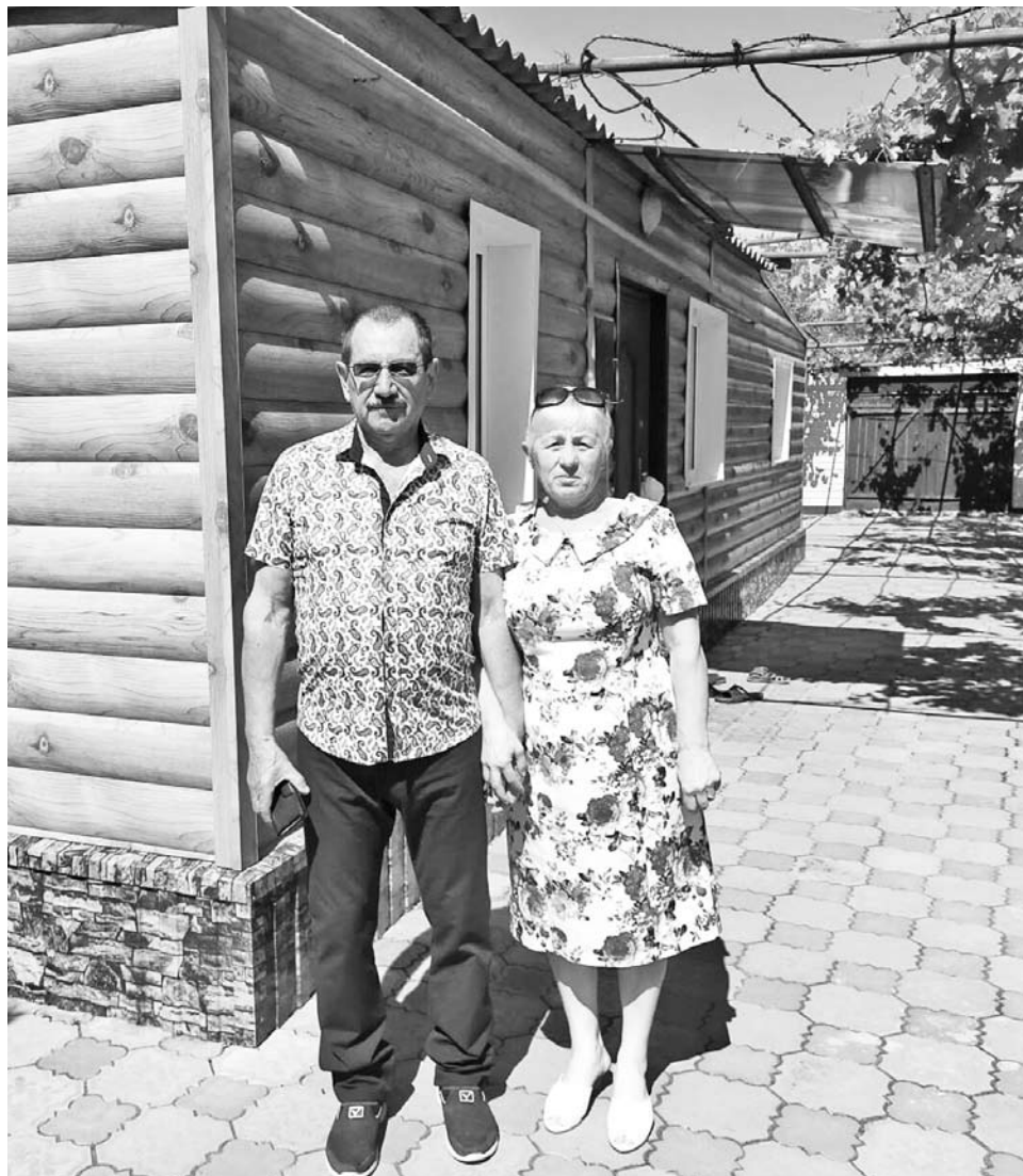
Супруги Межуевы вместе 50 лет

Г.Тележанина, художник ДК п.Селивановка