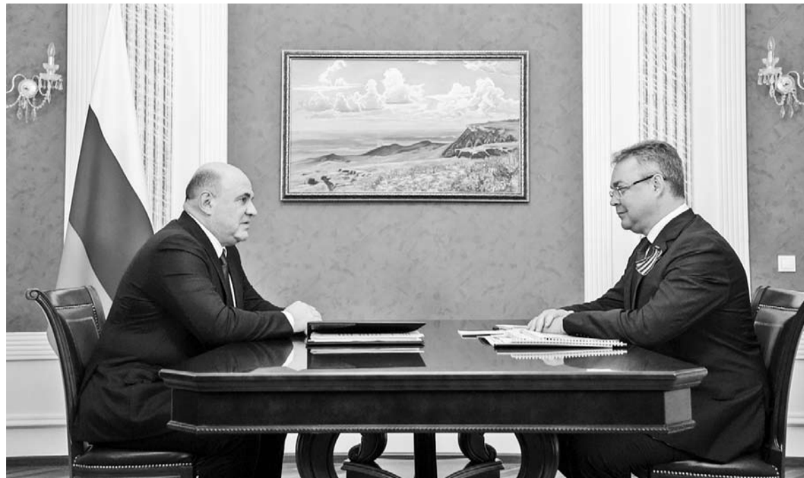
Премьер-министр Михаил Мишустин в ходе встречи с губернатором Владимиром Владимировым отметил позитивную динамику роста ключевых показателей социально-экономической сферы Ставрополья

В рамках рабочей поездки на Северный Кавказ премьер-министр РФ Михаил Мишустин провёл на Ставрополье встречу с губернатором Владимиром Владимировым.