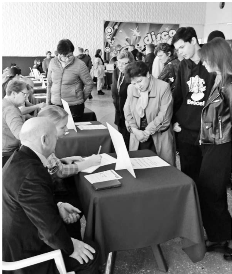
Жители района знакомятся с перечнем вакансий напрямую от работодателей

На встречу, организованную в центре занятости, пришли порядка 30 человек. С использованием наглядного демонстрационного материала специалисты