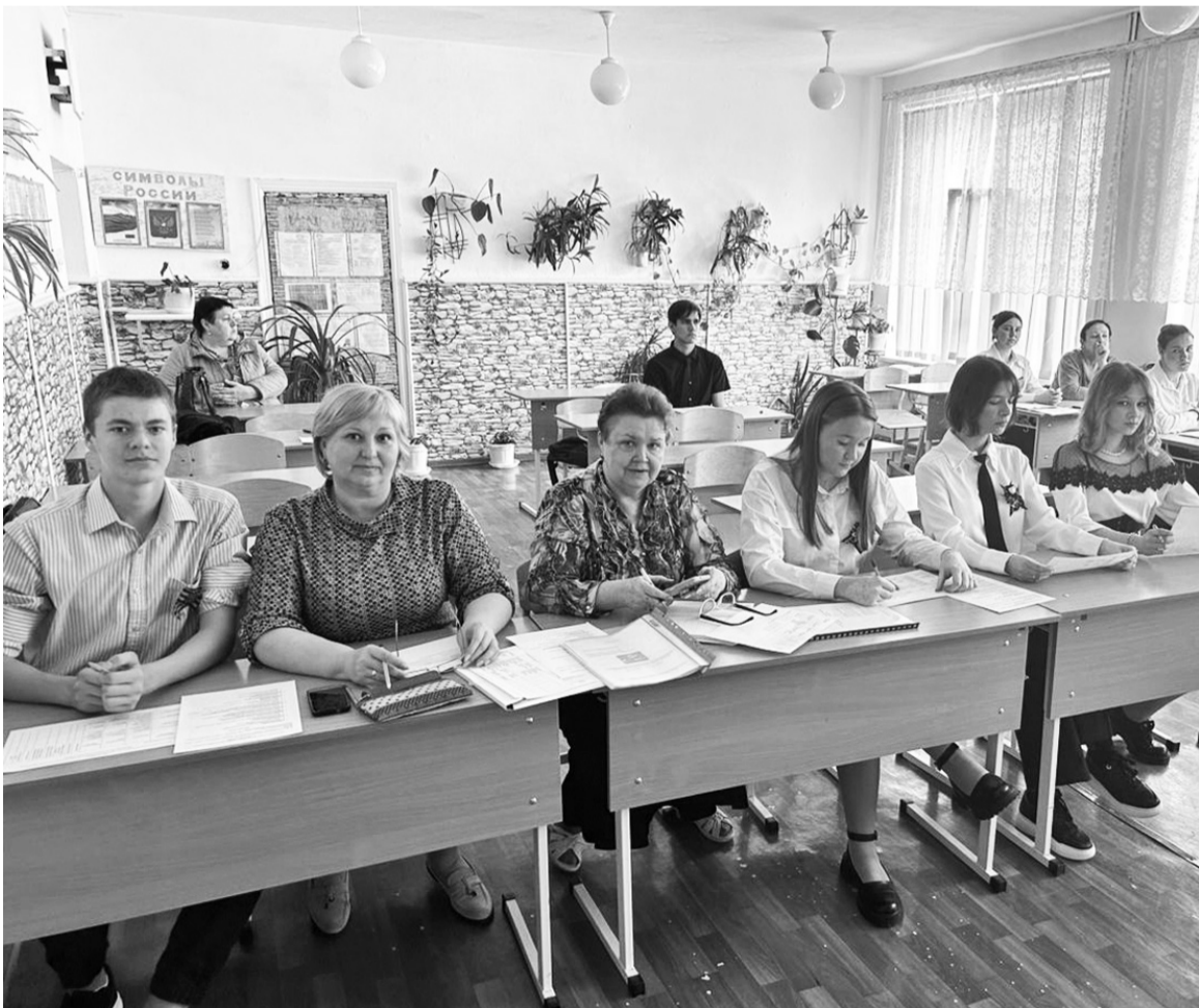
Жюри отметило высокий уровень всех работ