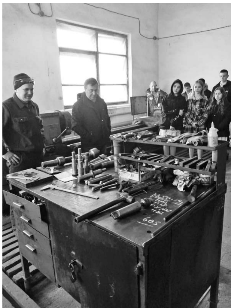
Экскурсия для школьников в токарном цехе