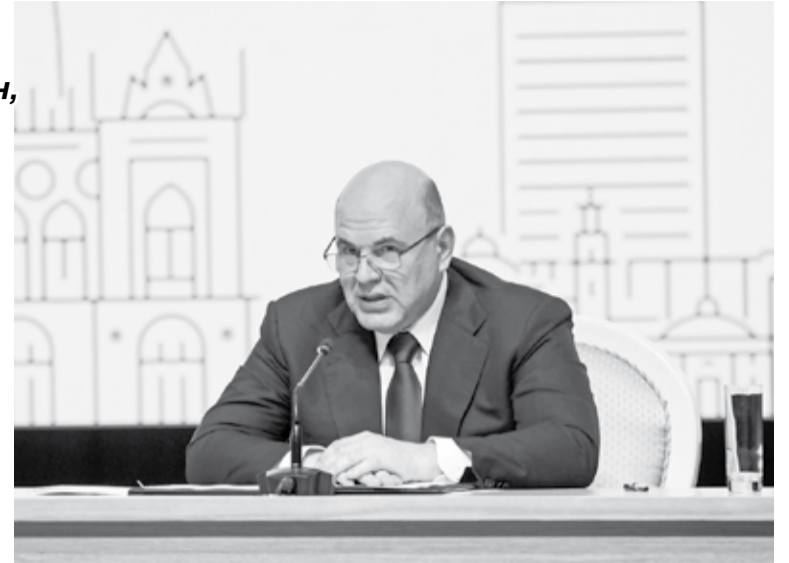
Михаил Мишустин отметил важность развития межрегионального сотрудничества для укрепления экономик России и Азербайджана в современных условиях

Михаил Мишустин назвал российские регионы, наиболее активно развивающие внешнеэкономическое партнёрство с Азербайджаном. Это Москва, Краснодарский и Ставрополь-