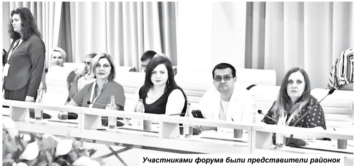
Участниками форума были представители районов