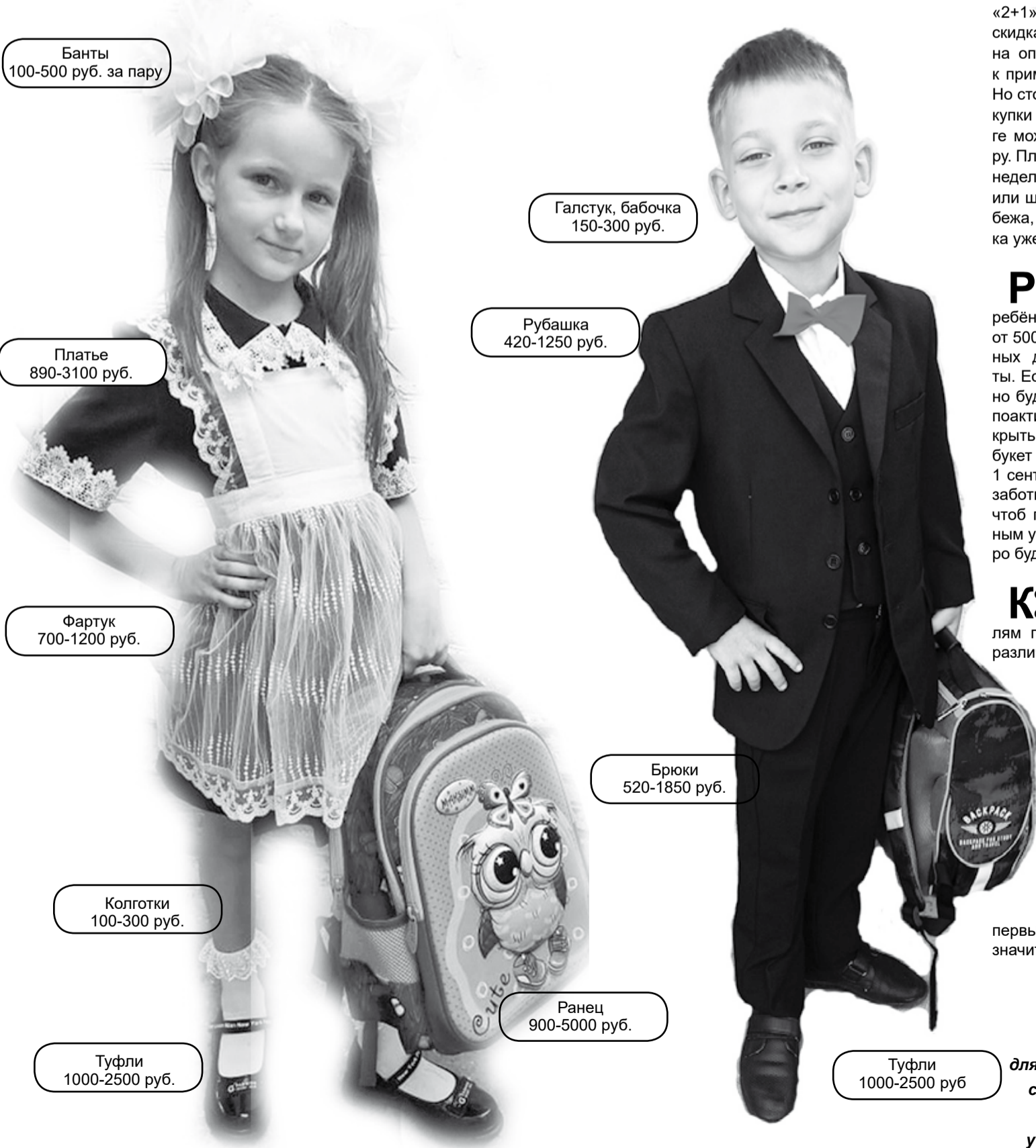
Туфли 1000-2500 руб