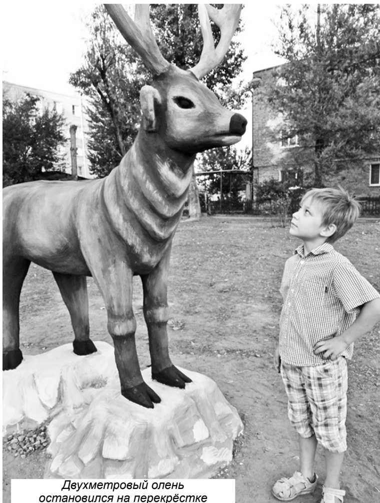
Двухметровый олень остановился на перекрёстке