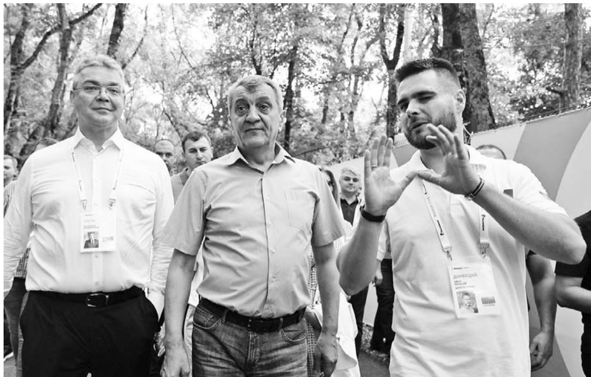
Владимир Владимиров и Сергей Меняйло осматривают территорию проведения форума