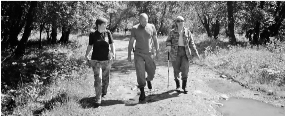
Казак на отдыхе.