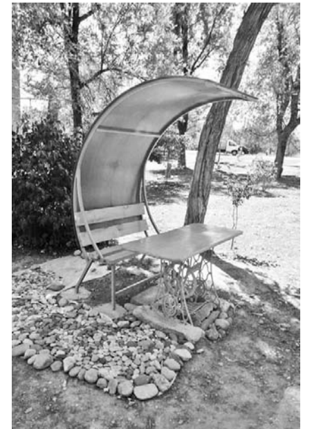
Место для отдыха