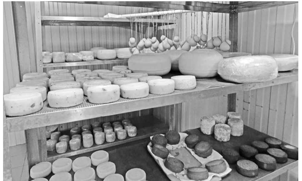
Сыроварня выпускает порядка 15 наименований сыров

Исходным сырьём для производства является качественное молоко, поступающее из двух фермерских хозяйств нашего района и прошедшее ветеринарную пробу. Технологический процесс производства сыров построен на принципах строгого соблюдения всех санитарных норм и правил. При изготовлении изде-