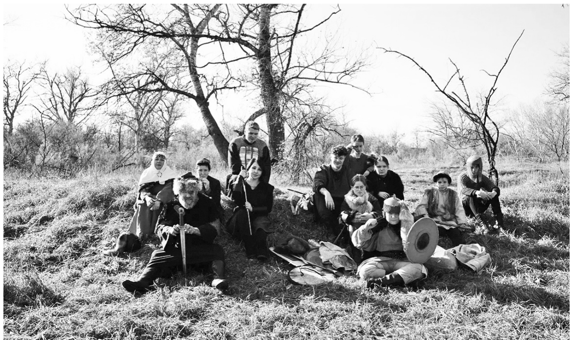
Рабочий момент съёмки фильма

А.Богатырева, младший научный сотрудник Зеленокумского краеведческого музея