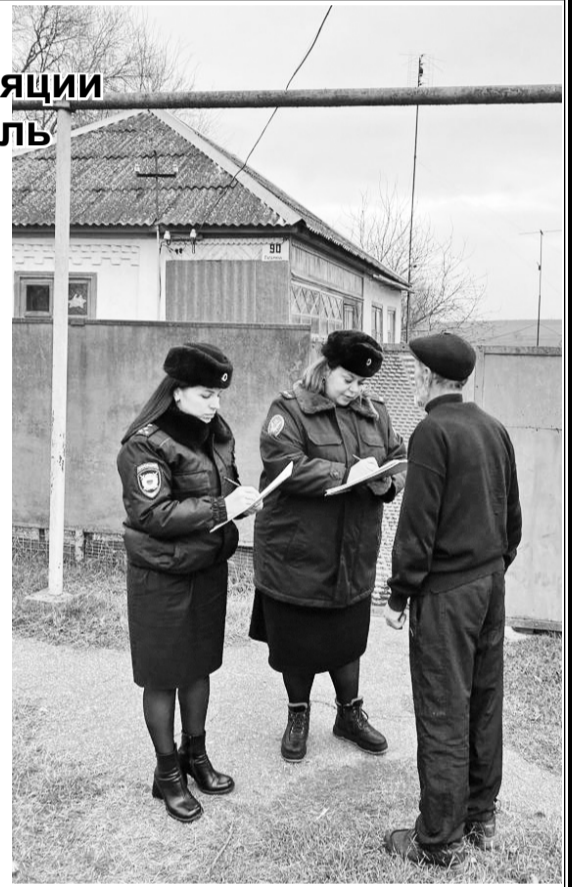
Сотрудники двух ведомств провели профилактические беседы

А. Финаева, начальник Советского МФ ФКУ УИИ УФСИН по краю