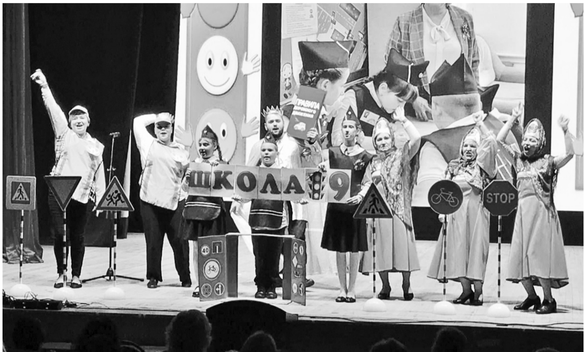
Взрослые танцуют и поют, лишь бы дети соблюдали правила дорожного движения