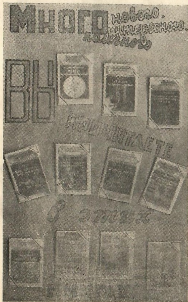
Выставка литературы по естествознанию

Для читателей я подготовил беседу о И. В. Мичурине и обзор выставленной литературы.