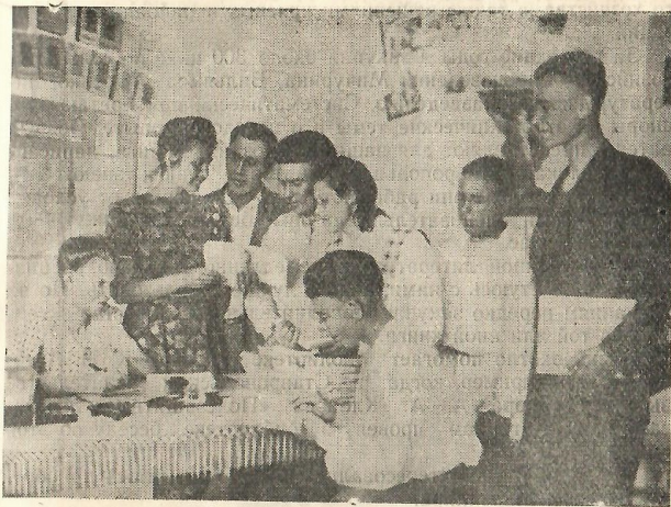
Беседа на абонементе

Часто приходят к нам механизаторы из МТС и спрашивают картотеку Сельсо. Эта картотека есть и в библиотеке МТС, но там трактористы и комбайнеры ею не пользуются, так как трудно найти то, что нужно. У меня же составлена вспомогательная тематическая картотека, с помощью которой я быстро нахожу необходимый ответ на вопрос комбайнера, тракториста, механика.