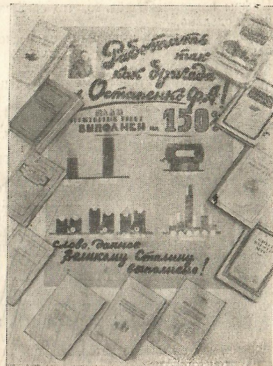
Пропаганда литературы о лучшем опыте трактористов

Чтобы всегда быть в курсе колхозных дел, библиотекаря необходимо следить за сводками о ходе работ в колхозах. Однако этого недостаточно, ведь сводка не все отражает.