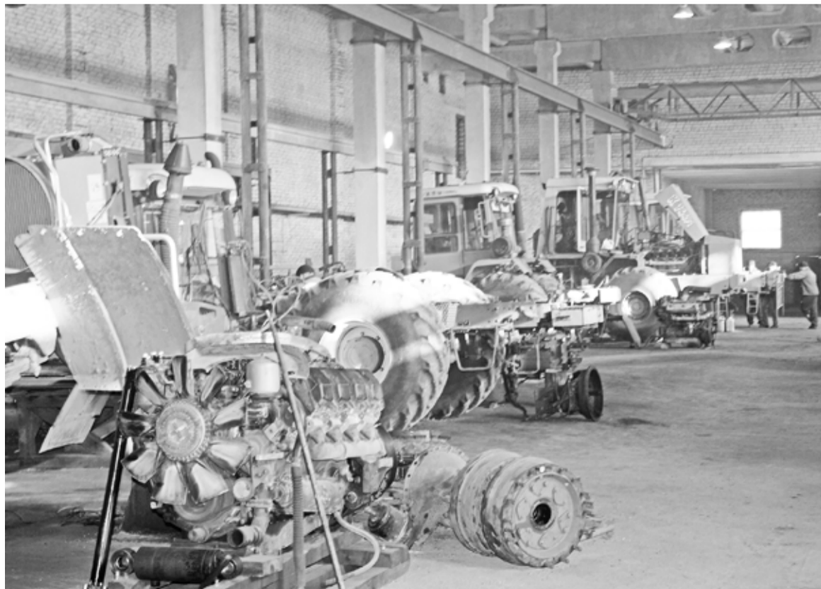
Цеха мастерских заполнены тракторами разных классов