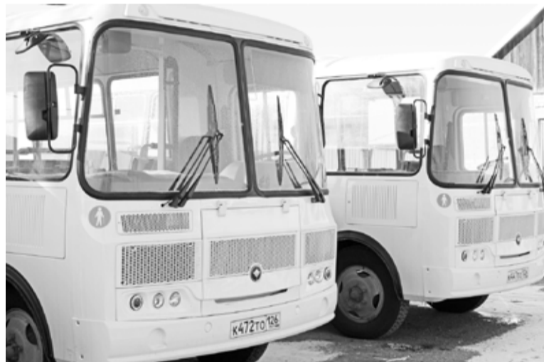
В прошлом году колхоз приобрёл два новых автобуса