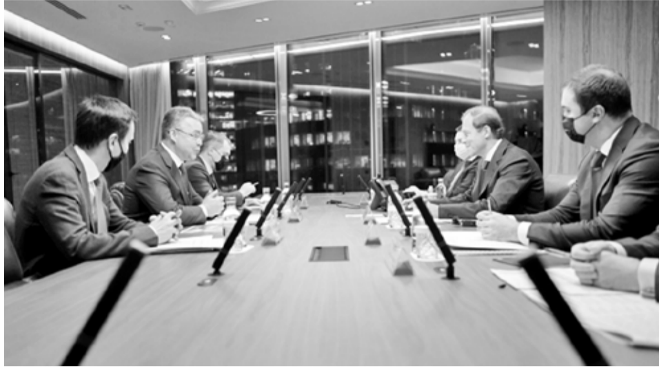
Минпромторг России поддержит развитие промышленных зон на Ставрополье

— Сегодня мы видим существенную диспропорцию в размещении подготовленной промышленной инфраструктуры. Порядка 70% индустриальных парков и промышленных технопарков приходится на Центральный и Приволжский федеральные округа, а на Северном Кавказе расположено только 4% площадок. Создание особой экономической зоны с подготовленной инфраструктурой позволит не только снизить стоимость открытия нового производства благодаря налоговым и таможенным льготам, но и существенно снизить сроки открытия таких производств при наличии всей необходимой инфраструктуры, — прокомментиро-