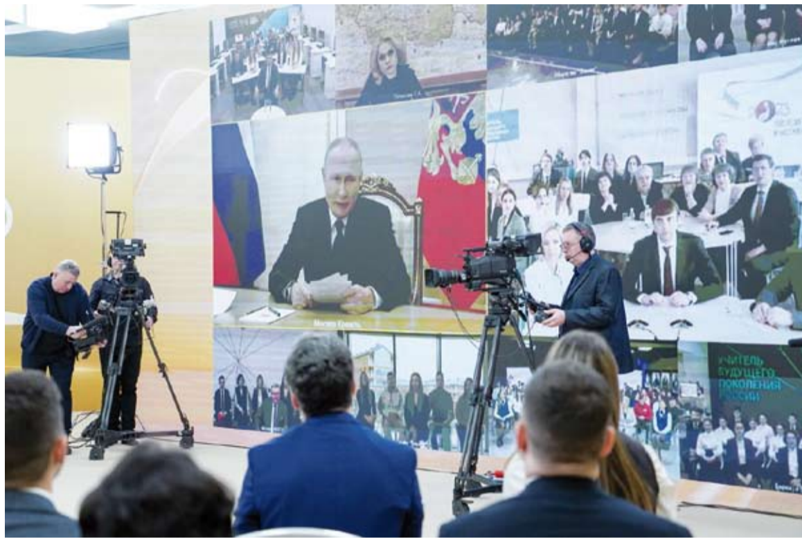
Президент РФ дал старт российскому Году педагога и наставника в ходе телемоста с Центром знаний «Машук»

В России дан старт Году педагога и наставника. В ходе телемоста с действующим на Ставрополье Центром знаний «Машук» об этом объявил президент России Владимир Путин.