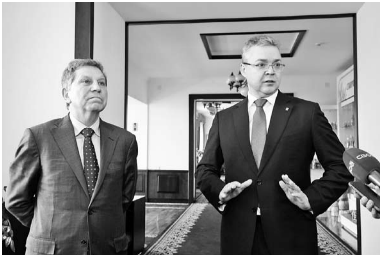
В.Владимиров: «Российская нефтяная компания является партнёром края в реализации двух из пяти «прорывных» проектов региональной модели экономического развития на период до 2030 года».

– Сегодня наши стратегические партнёры подхватили активности и проекты ушедшей из России иностранной компании. Они управляют крупнейшим электрогенерирующим объектом региона – Невинномысской ГРЭС. Готовы инвестировать в «зелёную» энергетику – строительство Родниковской ветроэлектростанции в Кочубеевском округе и солнечной электростанции в Невинномысске. В настоящее время в крае работают пять ветроэлектростанций общей мощностью 510 мегаватт. В сотрудничестве с нашими партнёрами мы рассчитываем в ближайшие годы увеличить эти мощности ещё